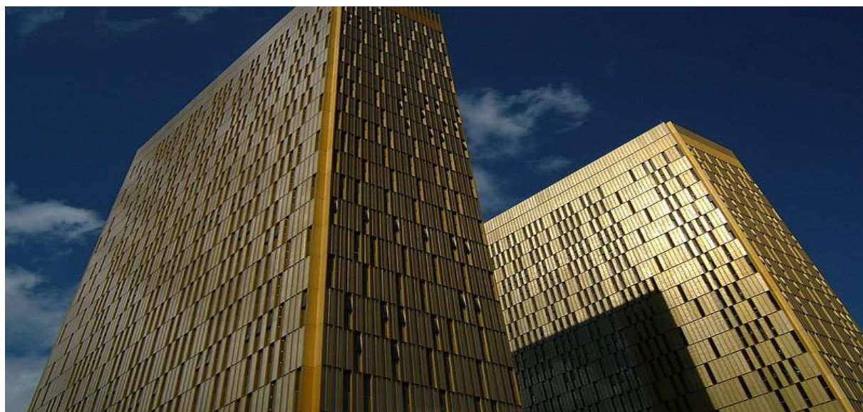
Slika 3. Zgrada Europskog suda pravde u Luxembourgu

Europski sud pravde (Slika 3.) tijelo je koje je jedini ovlašteni tumač osnivačkih ugovora. zadaća ove institucije rješavanje je sporova između država članica, između Europske unije i država članica, između institucija i Europske unije, te između pojedinaca i Europske unije. [5]