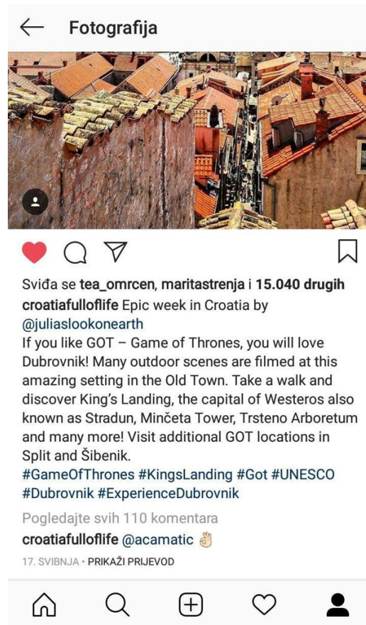
Slika 9. Grad Dubrovnik na Instagram profilu Croatia full of life