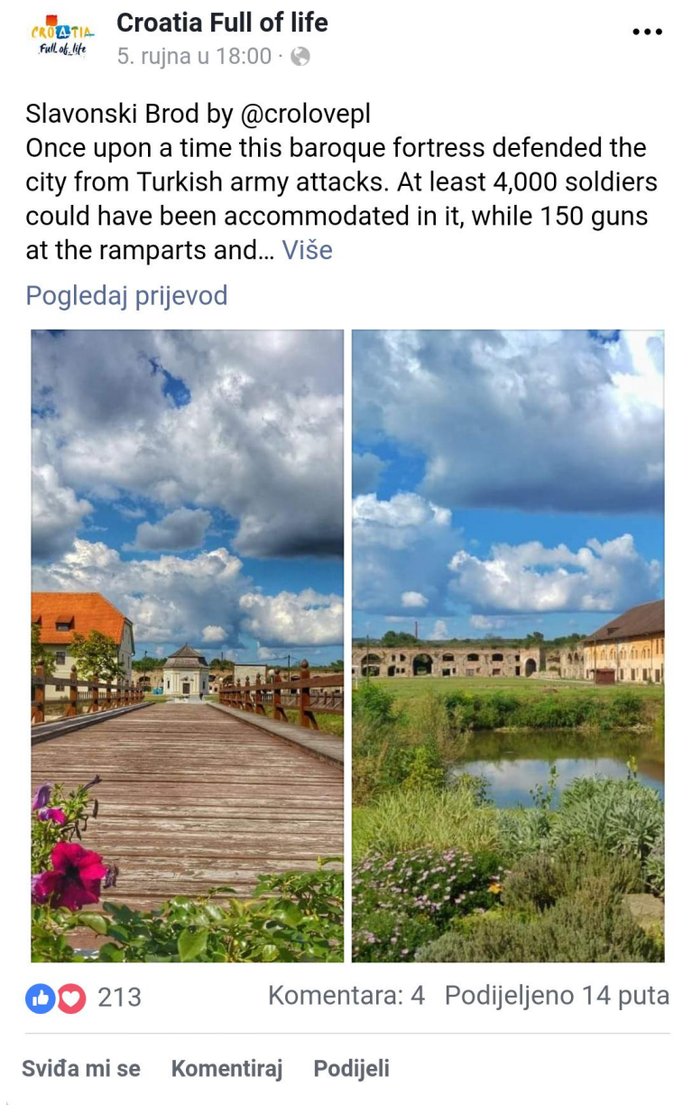
Slika 7. Slavonski Brod na Facebook profilu Croatia full of life

objavljaju se informacije o hrvatskoj turističkoj ponudi, destinacijama i događanjima, kao i ostale vijesti i zanimljivosti vezane uz hrvatski turizam. 28