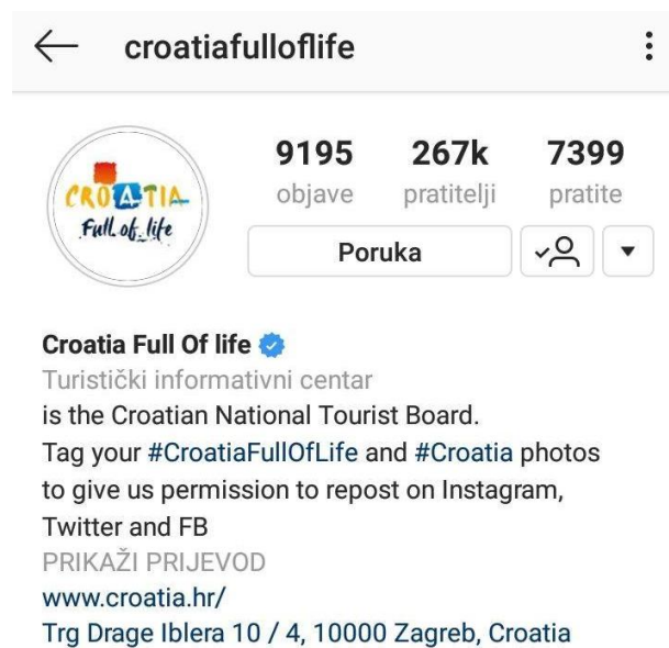
Slika 8. Pratitelji i broj objava na Instagram profilu Croatia full of life

Hrvatska se na društvenim mrežama prezentira kao atraktivna i neistražena destinacija, prepuna raznolikosti i bogate turističke ponude. Pritom se najčešće koriste fotografije koje prate godišnja doba i konkretne turističke proizvode, ali i one koje prikazuju poznate destinacijske znamenitosti. Sve aktivnosti su usklađene i s novim komunikacijskim konceptom koji je istovremeno održiv i prilagodljiv specifičnim ciljevima i turističkim proizvodima. Cilj aktivnosti na društvenim mrežama je zadržati pozornost, stimulirati um i izazvati emocije kod ciljane publike, a dosadašnje reakcije fanova na svim društvenim mrežama, a tako i na instagram profilu što se tiče Hrvatske turističke zajednice smatram da su su vrlo pozitivne.