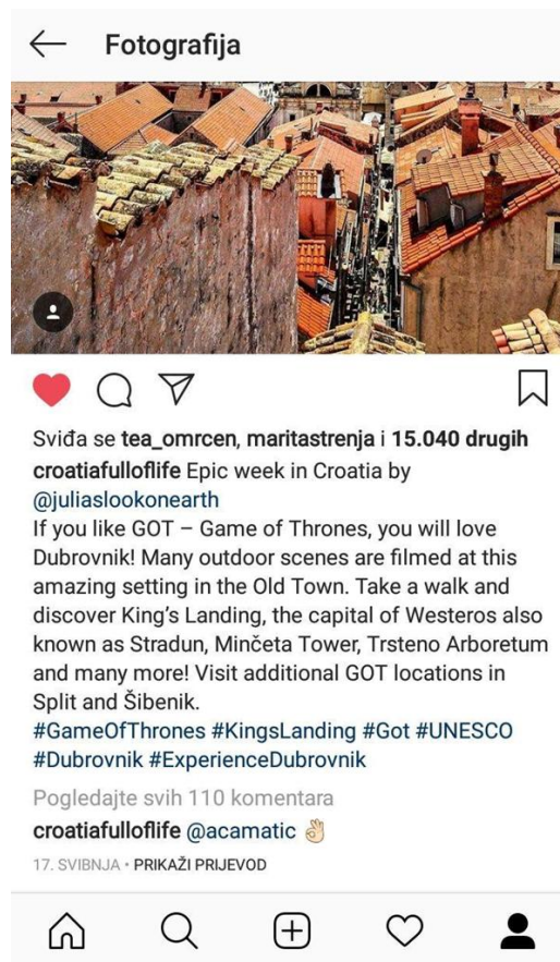
Slika 9. Grad Dubrovnik na Instagram profilu Croatia full of life