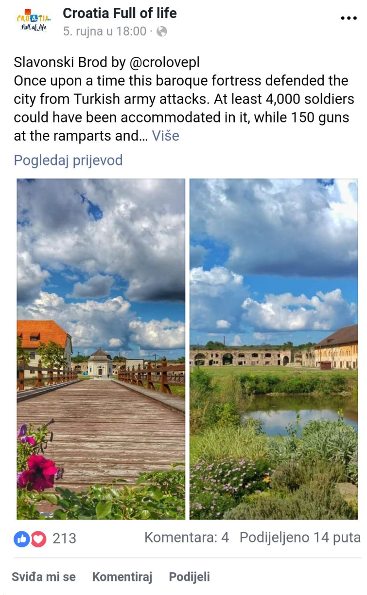
Slika 7. Slavonki Brod na Facebook profilu Croatia full of life

objavljaju se informacije o hrvatskoj turističkoj ponudi, destinacijama i događanjima, kao i ostale vijesti i zanimljivosti vezane uz hrvatski turizam. 28