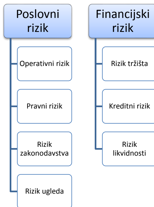
Slika 2. Osnovna podjela rizika