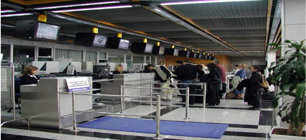
Slika 1. Zaposlenici Zračne luke Split

Troškovi osoblja podrazumijeva neto plaće zaposlenicima i porezi i doprinosi na plaće i iz plaća zaposlenih