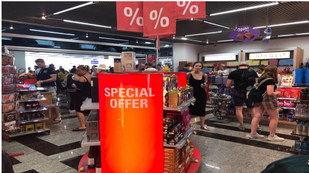
Slika 6. Duty free Shop