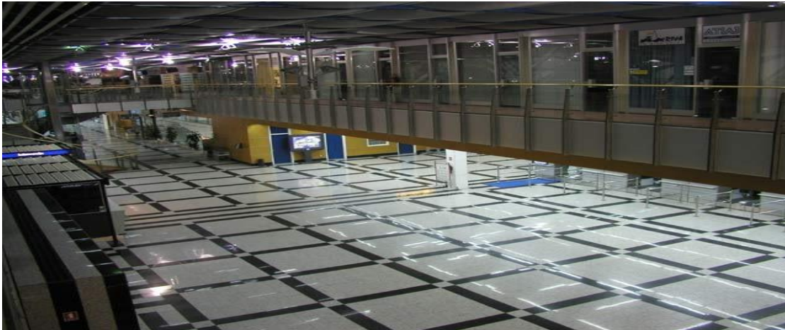
Slika 8. Putnička zgrada zračne luke Split