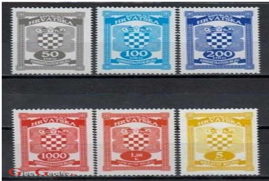
Slika 2. Takse