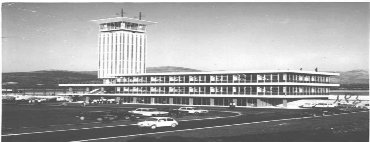
Slika 7. Zračna luka Split 1966.

U godinama koje su slijedile dolazi do pada prometa vojnih zrakoplova koji ne prati znatnije povećanje prometa civilnih zrakoplova. Ukupni promet zrakoplova opada, a promet putnika kreće se oko 500 000 putnika godišnje.