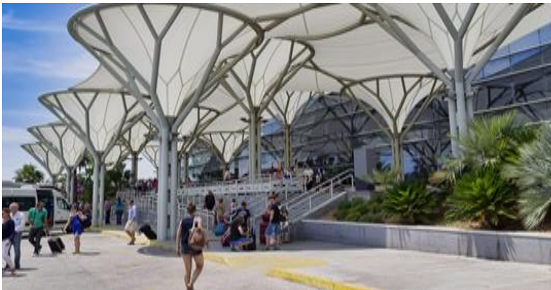
Slika 5. Zračna luka Split