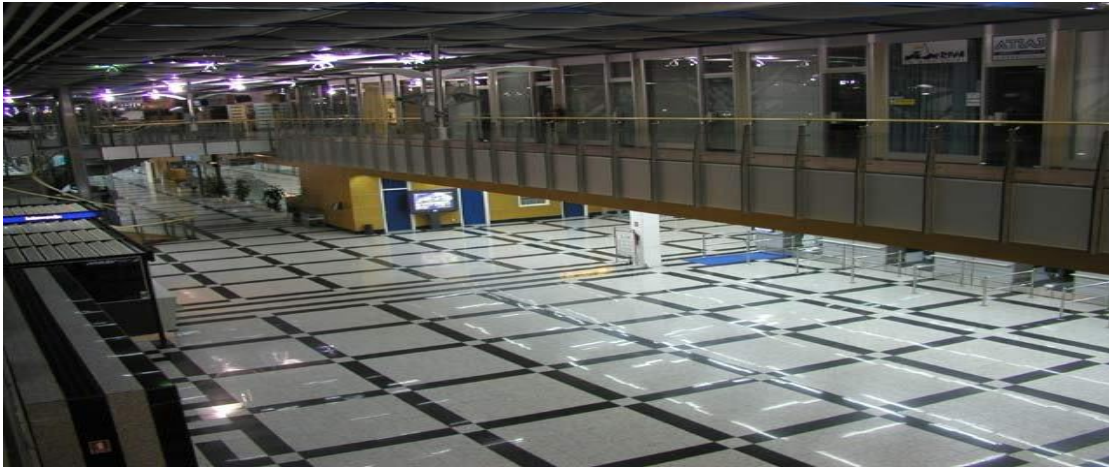
Slika 8. Putnička zgrada zračne luke Split