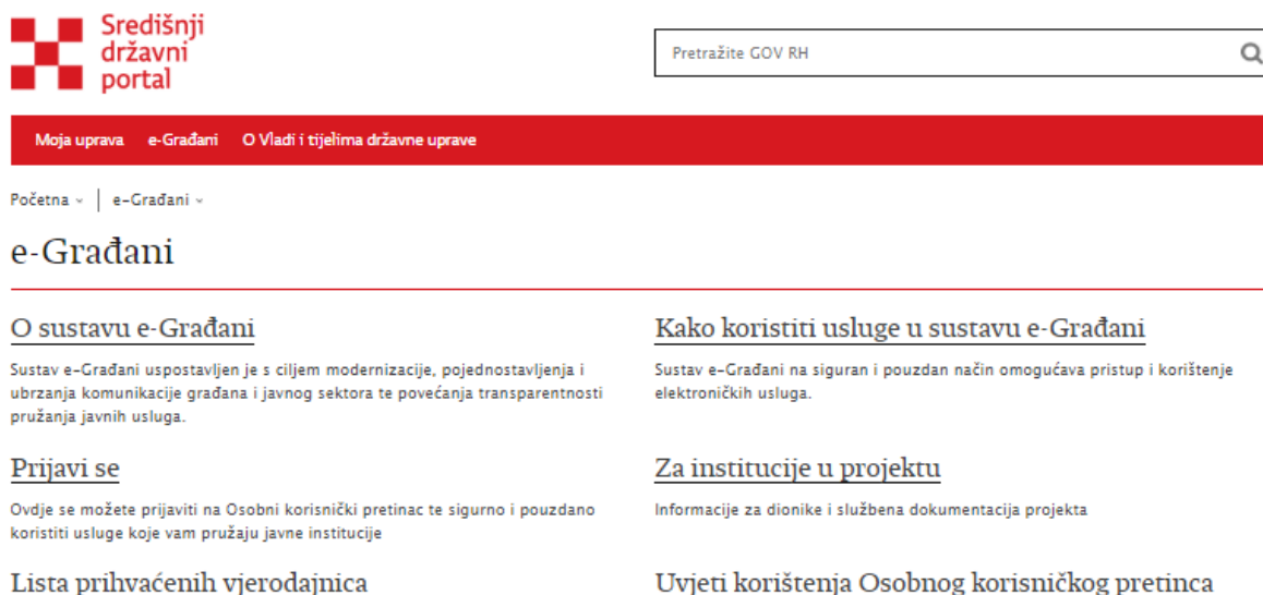
Slika 1. Središnji državni portal(Korisničko sučelje stranice)