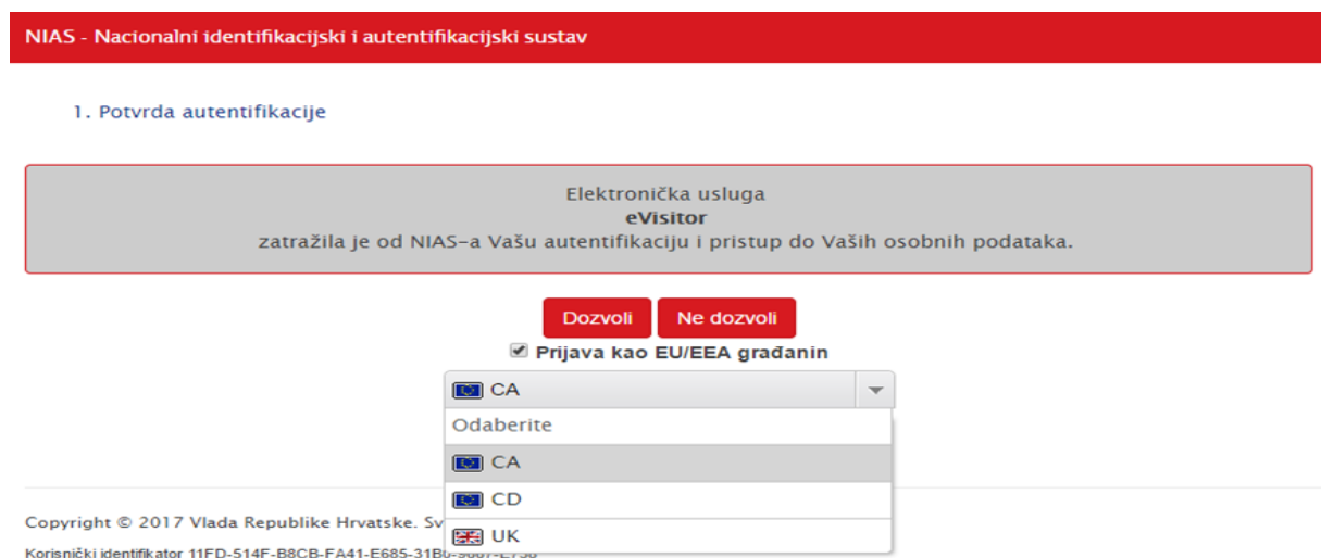
Slika2. Nacionalni identifikacijski i autentifikacijski sustav