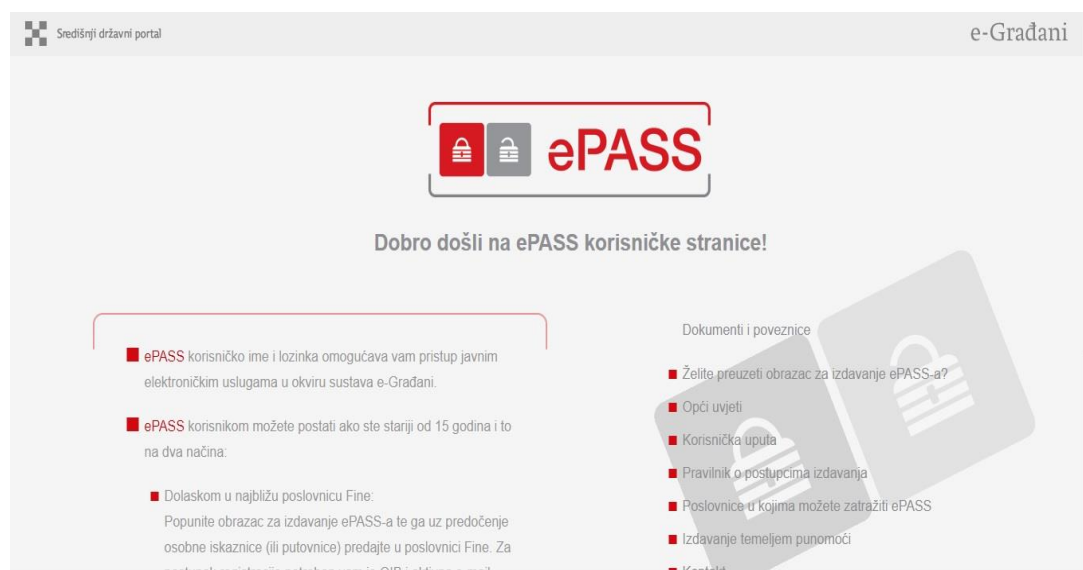
Slika 4 . ePASS