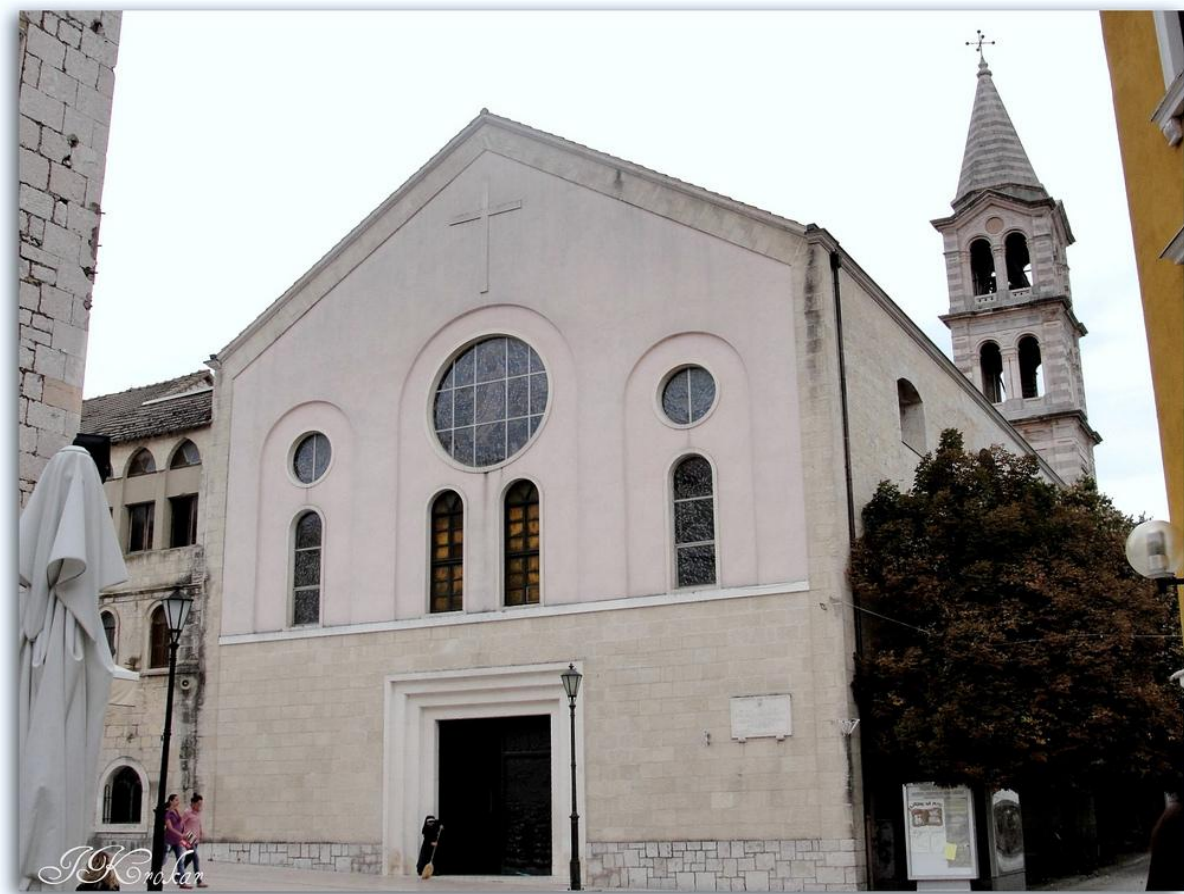
Slika 1. vanjski izgled crkve Čudotvorne gospe Sinjske

Kao najbitnije spomenike i znamenitosti grada možemo izdvojiti prije svega crkvu Čudotvorne gospe Sinjske u kojoj se nalazi i zlatom i srebrom okrunjena slika Majke Božije.