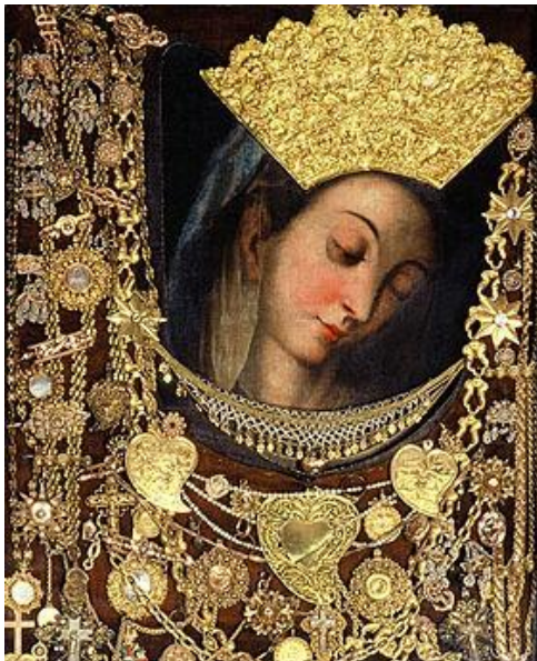
Slika 3. Čudotvorna gospa Sinjska okrunjena zlatom