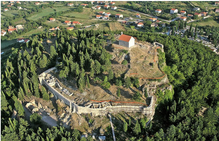
Slika 5. Stari grad Sinj

Izvor: http://www.visitsinj.com/hr/Vodic/42/kamicak 10