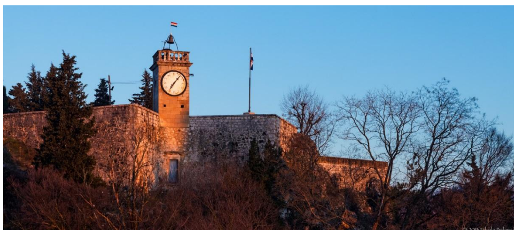
Slika 4. Kamičak

Izvor: http://www.visitsinj.com/hr/Vodic/42/kamicak 9