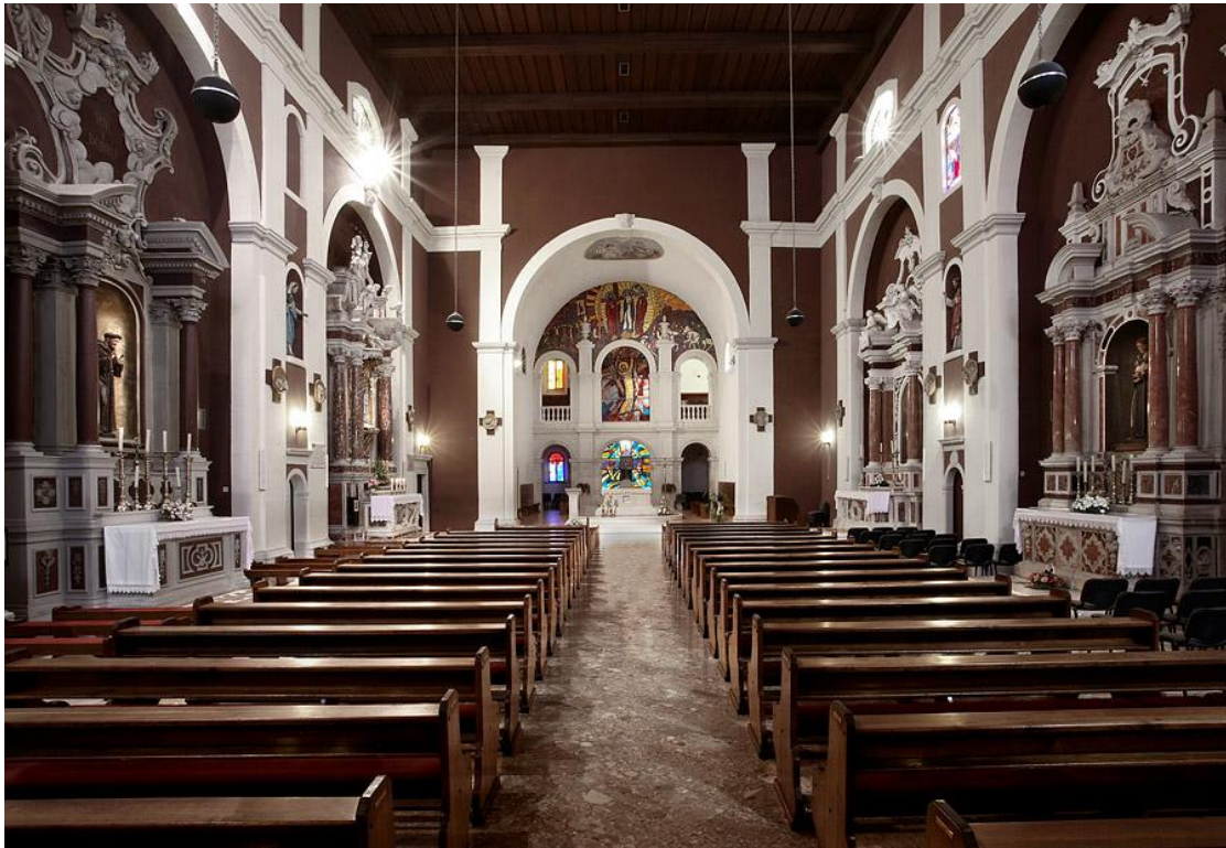
Slika 2. Unutrašnjost crkve Čudotvorne gospe Sinjske