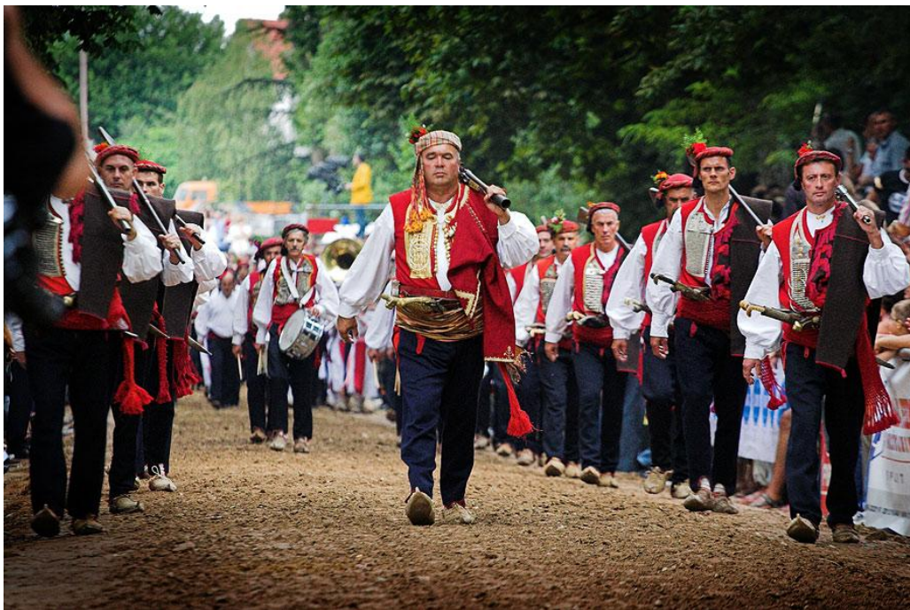
Slika 6. Alkarska povorka

Izvor: http://www.visitsinj.com/hr/Vodic/42/ 12