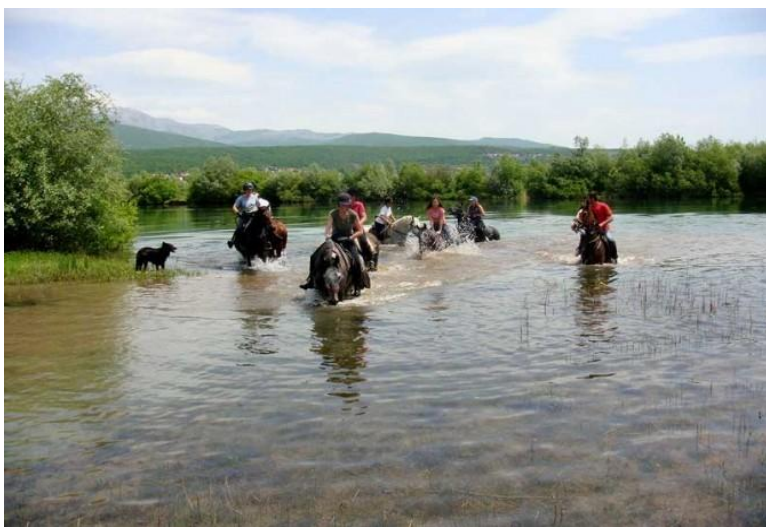
Slika 7: Izletnici ranča „Mustang“ na jahanju na Cetini

Izvor: https://www.facebook.com/rancmustang.glavice/photo 14