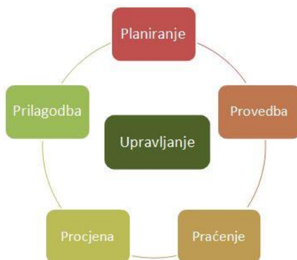
Slika 2. Proces prilagodljivog (adaptivnog) upravljanja.