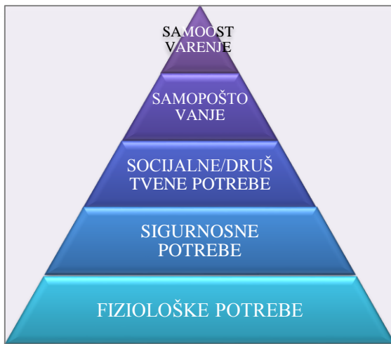
Slika 2: Maslovljeva piramida potreba

sposobnosti, spontanost, rješavanje problema, moralnost i manjak predrasuda, prihvaćanje činjenica). Na najvišoj točki piramide ljudi ostvaruju svoje primarne potrebe i stvaraju osnovu za daljnji razvoj, sklonost prema stjecanju znanja, estetici, razvijanju hobija i podizanju kvalitete života. Prema Fulgosiju (1997, 249), „cilj ili svrha života je aktualizacija ljudskih potencijala ili mogućnosti, odnosno samoaktualizacija svakog pojedinca“, a osobe koje ne rastu i ne razvijaju se nikad ne dostižu razinu ljudske egzistencije. Ljudi zadovoljavaju želje i potrebe prema određenom redosljedu važnosti, od nižih prema višim, stoga je hijerarhijski položaj određene potrebe Maslow prikazao u obliku piramide, prikazano na slici 2: