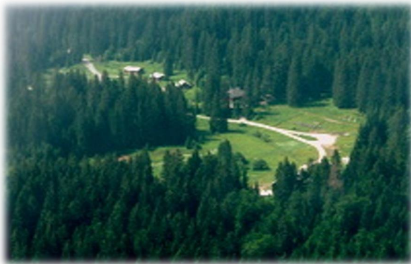
Slika 6. Štirovača.