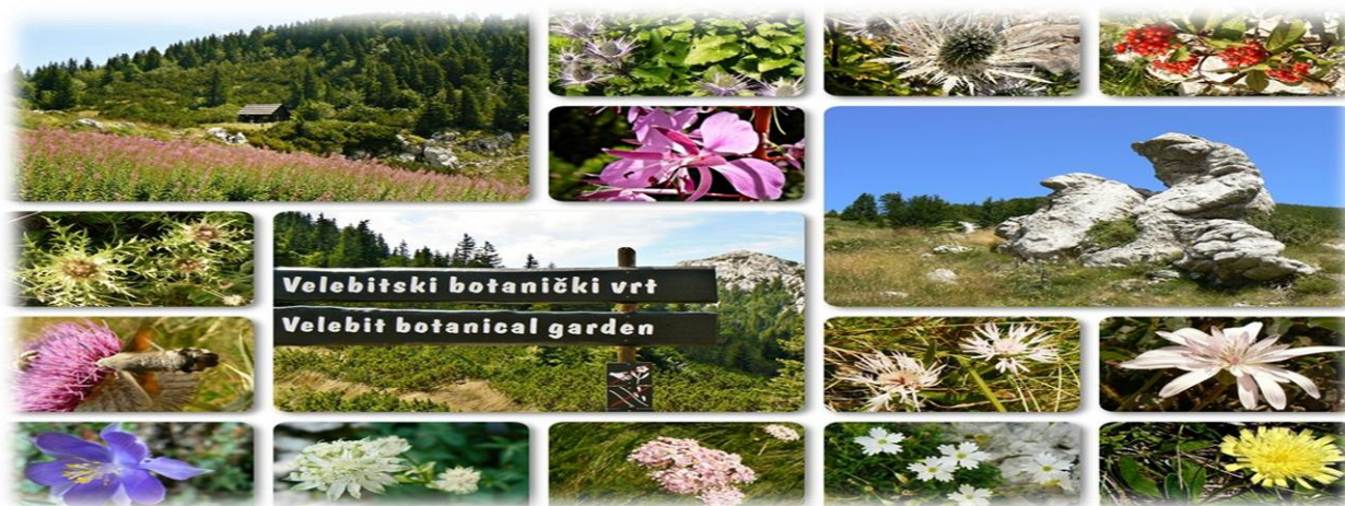
Slika 4. Velebitski botanički vrt.