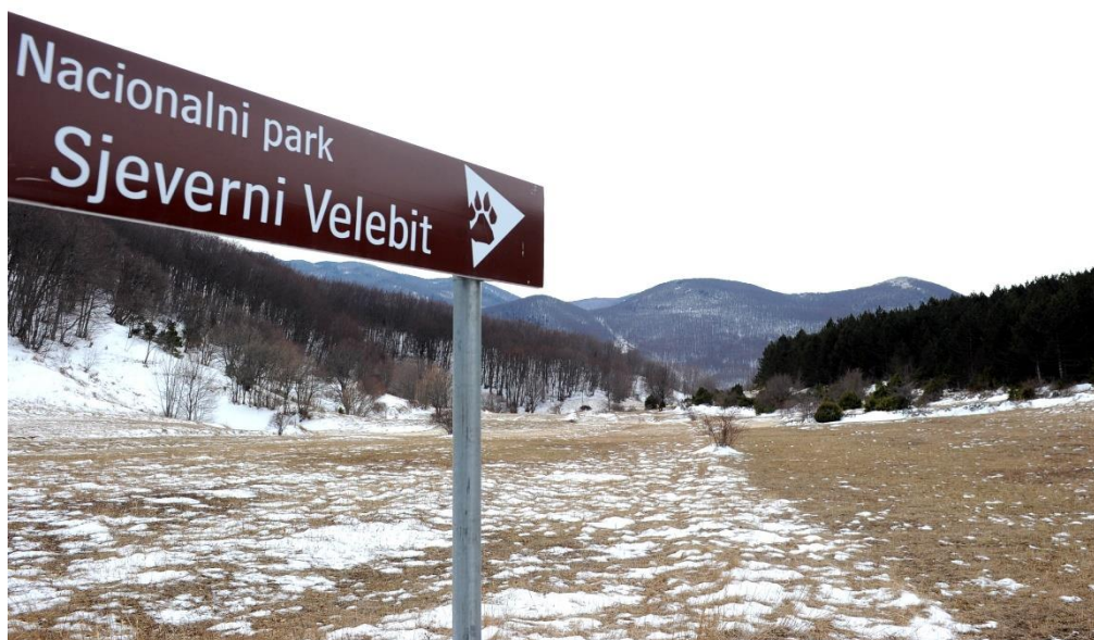
Slika 3. Nacionalni park Sjeverni Velebit.

U pogledu vegetacije nacionalnog parka Sjeverni Velebit nailazimo na šumske, travnjačke (pašnjačke) te zajednice stijena i kamenjara. Travnjačke zajednice značajne su za 40 vrsta danjih leptira koliko ih je u Parku zabilježeno. Sedam leptira smjestilo se na Crveni popis danjih leptira hrvatske. 29 2007. godine ovo područje je uključeno u prijedlog Nacionalne ekološke mreže. Sjeverni Velebit pripada dijelu šireg područja „ Velebit“ uključenom u prijedlog Nacionalne ekološke mreže kao međunarodno važno područje za ptice (NATURA 2000) te ostale vrste i staništa.