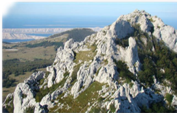
Slika 5. Hajdučki i Rožanski kukovi.