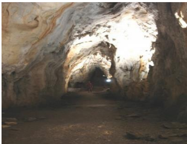
Slika 9. Cerovačke pećine.