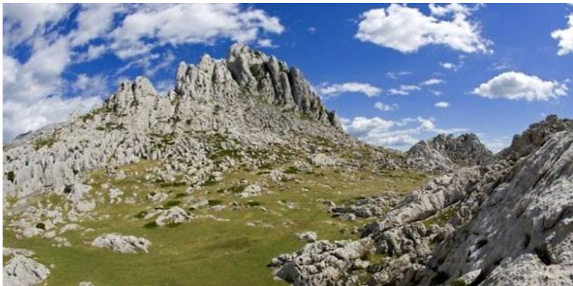
Slika 2. Park prirode Velebit.