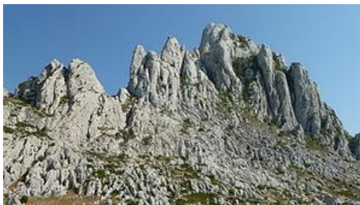
Slika 8. Tulove grede na jugoistočnom Velebitu.