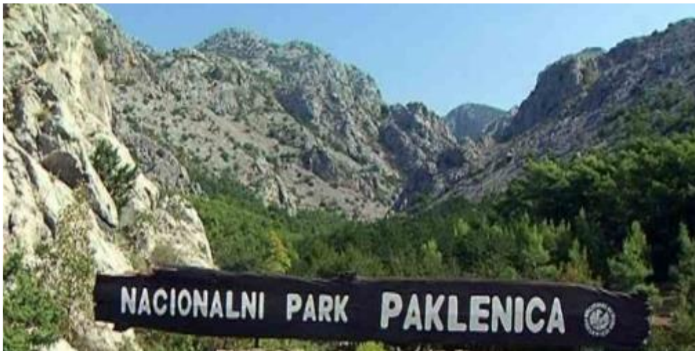
Slika 7. Nacionalni Park Paklenica.