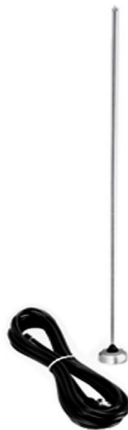
Slika 12. Antena Motorola HAD4007A