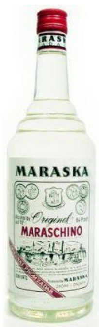
Slika 15. Zadarski maraschino