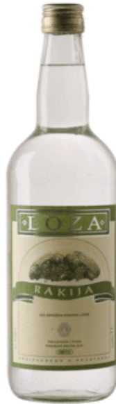
Slika 10. Loza