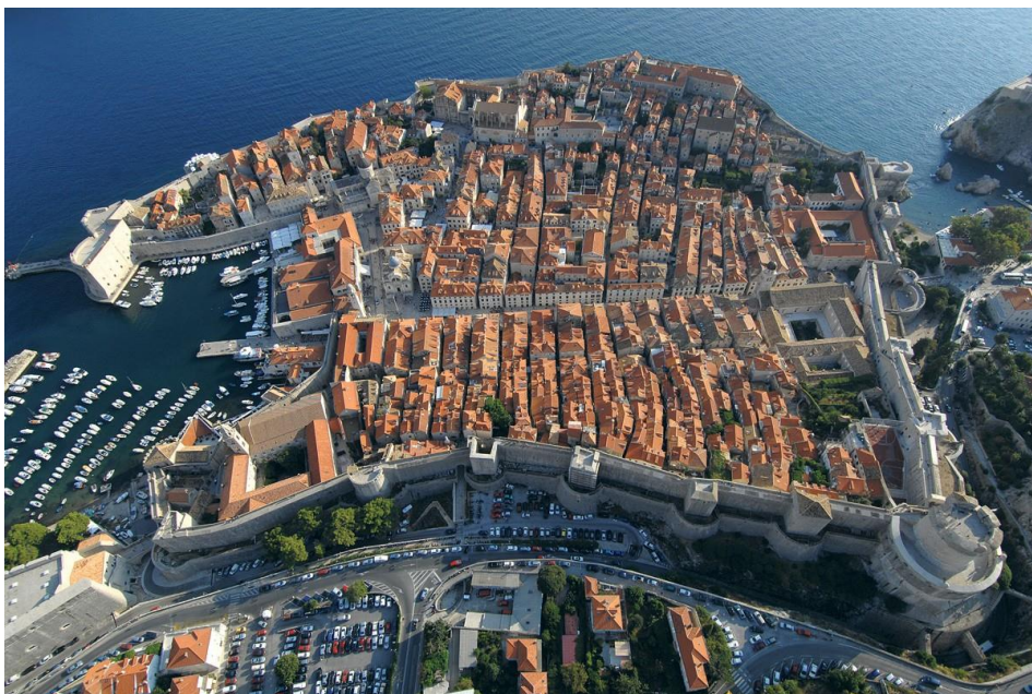
Slika 2. Dubrovačke gradske zidine

Dubrovačke gradske zidine su najslikovitiji simbol grada. Ove masivne kamene utvrde, koje okružuju Stari grad, izgrađene su između 12. i 17. stoljeća kao obrambeni mehanizam protiv osvajača. Protežući se otprilike 2 kilometra i dosežući visinu do 25 metara, zidine pružaju prekrasan pogled na Jadransko more i zgrade s crvenim krovovima Starog grada. Pješaćenje cijelom dužinom zidina popularna je aktivnost za turiste, pružajući jedinstvenu perspektivu na izgled grada i njegovu povijesnu arhitekturu. Putem posjetitelji mogu istražiti nekoliko kula i tvrđava, uključujući kulu Minčeta, najvišu točku zidina, s koje se pruža panoramski pogled na okolicu (Hrvatska enciklopedija, 2024).