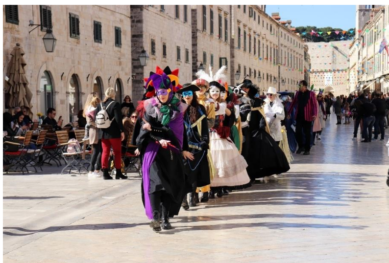
Slika 12. Dubrovački karnevo (karneval)