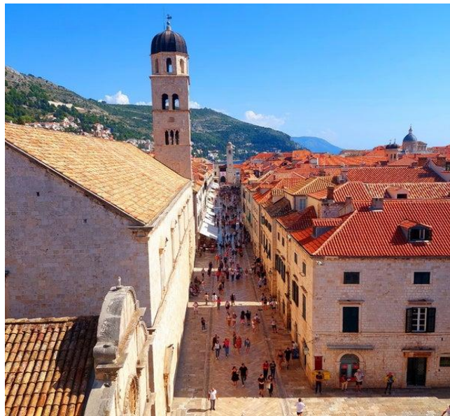
Slika 3. Stradun (Placa), Izvor: https://foursquare.com/v/placa-stradun/4c93afddf7cfa1cdaec3ac15

Stradun, poznat i kao Placa, glavna je ulica dubrovačkog Starog grada i služi kao društveno i trgovačko središte grada. Ova široka, vapnencem popločana prometnica proteže se otprilike 300 metara i obrubljena je elegantnim kamenim zgradama, trgovinama, kafićima i restoranima. Stradun je dokaz pažljivog urbanističkog planiranja grada, osmišljenog nakon razornog potresa 1667. koji je uništio veći dio Dubrovnika. Stradun nije samo središnje okupljalište mještana i turista već i mjesto održavanja raznih kulturnih manifestacija i festivala (Leksikon Marina Držića, 2024).