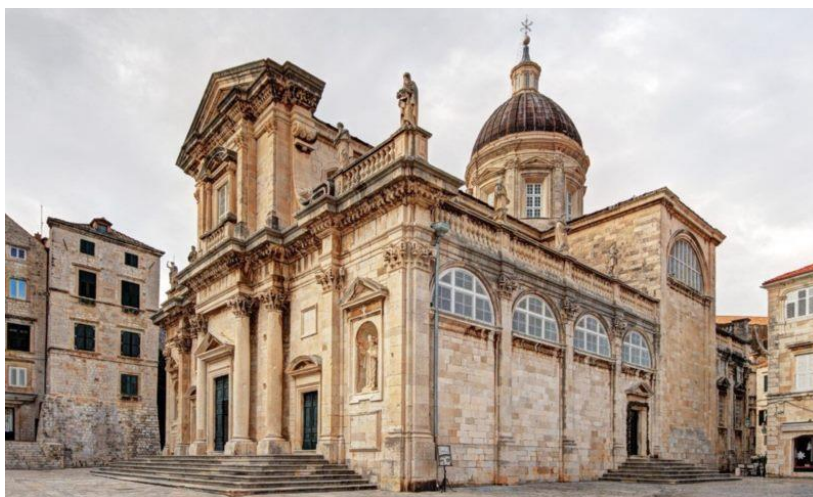
Slika 5. Dubrovačka katedrala, Izvor: https://tz.dubrovnik.hr/get/sakralni_objekti/5007/katedrala.html

Smještena na 37 metara visokoj litici neposredno izvan gradskih zidina, tvrđava Lovrijenac često se naziva „dubrovačkim Gibraltarom“. Ova građevina imala je presudnu ulogu u obrani grada od pomorskih napada. Tvrđava je svojim debelim zidinama i strateškim položajem bila simbol otpornosti i neovisnosti. Iznad ulaza na tvrđavu Lovrijenac je glasoviti natpis „Non bene pro toto venditur auro“ u prijevodu; „Sloboda se ne prodaje za svo blago svijeta“. Prvi službeni zapisi spominju tvrđavu 1301. godine iako se vjeruje da je gradnja počela i ranije (Turistička zajednica grada Dubrovnika, 2024.). Tvrđava Lovrijenac danas je popularna turistička atrakcija i mjesto kulturnih događaja, posebice tijekom Dubrovačkih ljetnih igara, kada se na njoj održavaju kazališne predstave i koncerti. S tvrđave se pruža prekrasan pogled na Jadransko more, gradske zidine i Stari grad, što je čini omiljenim mjestom za fotografiranje (Leksikon Marina Držića, 2024).