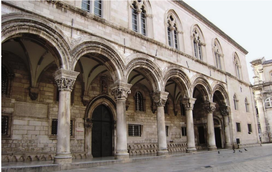
Slika 4. Knežev dvor

Dubrovačka katedrala, poznata i kao Katedrala Uznesenja Djevice Marije, barokno je remek-djelo koje stoji na mjestu ranijih crkava iz 7. stoljeća. Prema izvorima, bila je veličanstvena građevina ukrašena skulpturama (očuvano više fragmenta), neobične visine, jer je stoljeće nakon njezine izgradnje bila podignuta još jedna galerija oko koje se moglo hodati iznutra i izvana. Legenda kaže da je ta katedrala izgrađena zahvaljujući novcu koji je Dubrovačkoj Republici dao engleski kralj Rikard Lavljega Srca, koji se u Dubrovniku iskrcao 1192. (Leksikon Marina Držića, 2024). Sadašnja građevina, izgrađena nakon potresa 1667., ima veličanstvenu kupolu i bogato ukrašenu unutrašnjost. Katedrala je dom riznice koja čuva impresivnu zbirku vjerskih artefakata, uključujući relikvije svetog Vlaha, zaštitnika Dubrovnika. Najznačajnija relikvija je pozlaćena ruka, noga i lubanja sv. Vlaha, koje se nose u procesiji ulicama Starog grada za vrijeme godišnjeg blagdana sveca. Spokojna atmosfera katedrale i njezino umjetničko blago čine je mjestom koje moraju posjetiti oni koje zanima religijska umjetnost i povijest (Visit Dubrovnik, 2024).