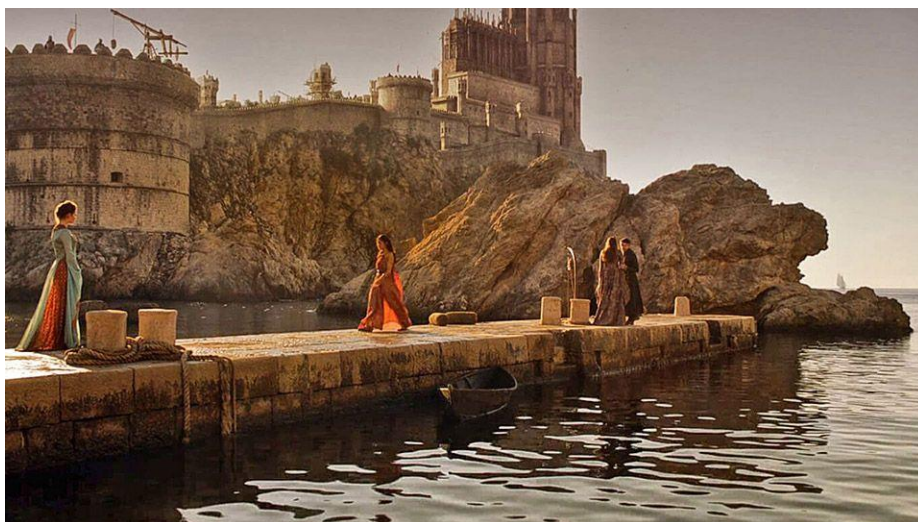
Slika 9. Isječak iz serije „Igra prijestolja“, lokacija uvala Pile

Dubrovnik je također bio dom mnogim značajnim ličnostima koje su dale važan doprinos na različitim poljima, uključujući književnost – Marin Držić, Ivan Gundulić, Ivan Stojanović, znanost – Ruđer Bošković, Stjepan Gradić, te umjetnost – Luka Sorkočević, Jakov Gotovac.