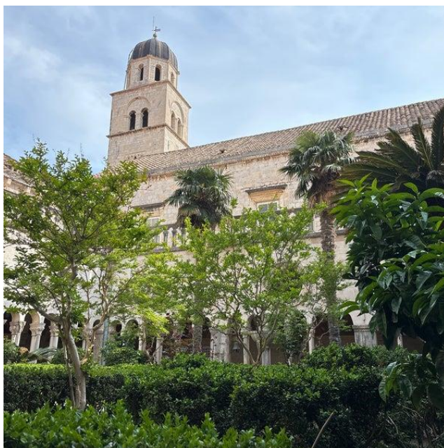
Slika 7. Franjevački samostan i muzej, Izvor: https://foursquare.com/v/franjeva%C4%8Dki-samostan--muzej-franciscan-monastery--museum/4dd6700c8877f1150fd001f5

Franjevački samostan, smješten u blizini Vrata od Pila na ulazu u Stari grad, još je jedna značajna znamenitost Dubrovnika. Prema legendi, Dubrovnik je na proputovanju u svetu zemlju, početkom 13. stoljeća, posjetio Franjo Asiški, te od tada franjevci djeluju u Dubrovniku. U samostanu, utemeljenom u 14. stoljeću, nalazi se jedna od najstarijih ljekarni u Europi koja kontinuirano radi od 1317. godine (Dubrovnik Digest, 2013). Klaustar samostana remek-djelo je romaničko-gotičke arhitekture, s mirnim vrtom okruženim arkadama s zamršeno isklesanim kamenim stupovima. U samostanu se također nalazi muzej koji prikazuje zbirku vjerskih artefakata, uključujući rukopise, umjetnine i predmete iz povijesti ljekarne. Mirna atmosfera Franjevačkog samostana nudi posjetiteljima mirno utočište od užurbanih ulica Starog grada (Hrvatska enciklopedija, 2024).