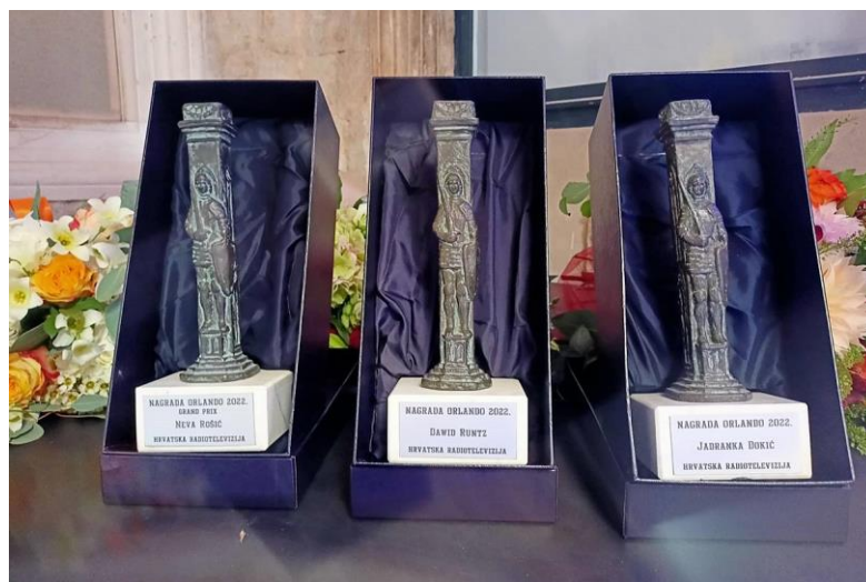
Slika 11. Nagrada Orlando, Izvor: https://dulist.hr/dodijeljene-nagrade-grand-prix-nevi-rosic-orlando-za-dawida-runtza-i-jadranku-dokic/783609/

Godine 1978. utemeljena je nagrada Orlando. Ova prestižna nagrada koja se dodjeljuje za najbolja umjetnička ostvarenja na Dubrovačkim ljetnim igrama. Ime je dobila po slavnom Orlandovom stupu, simbolu slobode i pravde u Dubrovniku. Nagrada Orlando dodjeljuje se u dvije kategorije: za najbolju dramsku ulogu i za najbolji glazbeni nastup. Posebna kategorija dodjele nagrade naziva se Grand Prix, nagrada za osobit umjetnički doprinos u više festivalskih sezona. Dobitnici nagrade Orlando uključuju najistaknutije umjetnike iz Hrvatske i šire regije kao što su: Rade Šerbedžija, Mia Begović, Goran Višnjić, Marko Mimica, Luka Šulić i dr. Svake godine, žiri sastavljen od istaknutih i kulturnih umjetničkih stručnjaka pažljivo ocjenjuje izvedbe na festivalu. Tijekom godina, nagrada je postala sinonim za izvrsnost u dramskoj i glazbenoj umjetnosti, te dodatno obogaćuje prestiž i važnost Dubrovačkih ljetnih igara na međunarodnoj kulturnoj sceni (Meet Dubrovnik, 2024).