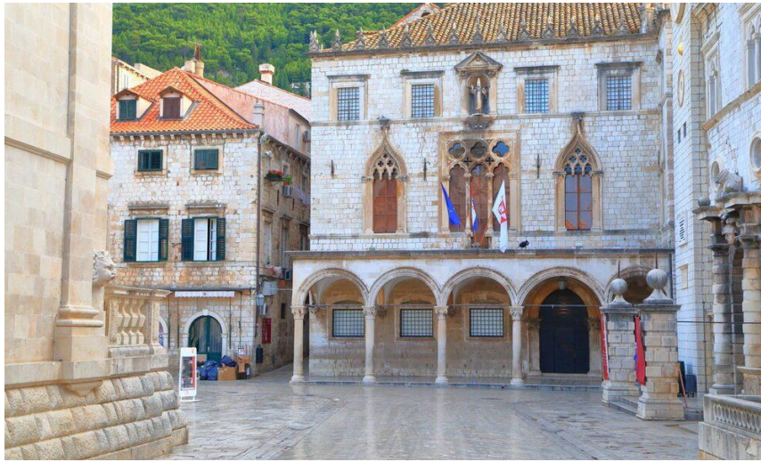
Slika 8. Palača Sponza (Danas Državni arhiv Dubrovnika), Izvor: https://kofer.info/palaca-sponza/

Posljednjih godina Dubrovnik je stekao dodatnu slavu kao mjesto snimanja raznih filmova i televizijskih serija. Najistaknutija od njih je HBO-ova Igra prijestolja, u kojoj je Dubrovnik korišten kao primarno mjesto snimanja fiktivnog grada King's Landing. Iznimna popularnost serije privukla je novi val turista koji žele posjetiti mjesta snimanja i doživjeti grad kroz objektiv serije. Grad nudi raznolika iskustva za posjetitelje kao što su pješačke ture. Nekoliko kompanija nudi pješačke ture koje posjetitelje vode kroz glavna mjesta snimanja u Dubrovniku. Vodiči često dijele priče iza kulisa, pokazuju usporedne fotografije iz serije te objašnjavaju kako su gradske znamenitosti pretvorene u kultne scene. Također nekoliko trgovina i izložbi je posvećeno seriji, nudeći tematske suvenire, memorabilije i detaljne izložbe u procesu snimanja. Dubrovnik je prihvatio svoju povezanost s „Igram prijestolja“, što ga čini nezaobilaznom destinacijom za obožavatelje te serije, a istovremeno nudi bogato povijesno i kulturno iskustvo. Iako je to donijelo gradu značajne ekonomske koristi, također je izazvalo zabrinutost zbog utjecaja masovnog turizma na povijesna mjesta grada (Dubrovnik Digest, 2013).