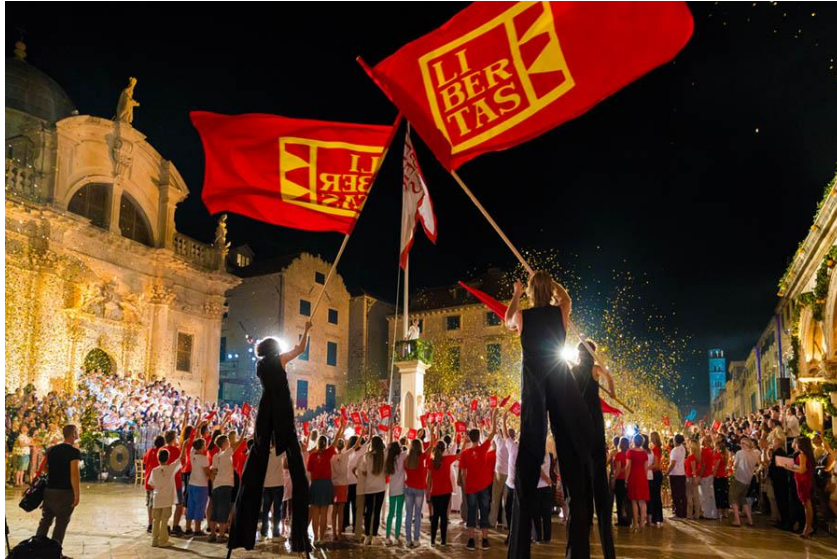
Slika 10. Otvaranje igara 2016. godine

U prvim godinama festival je bio više orijentiran na starija djela hrvatske i svjetske dramske književnosti (Marin Držić, Hanibal Lucić, Ivan Gundulić, Juraj Palmotić, Shakespeare, Sofoklo i dr.), ali su vrlo brzo u repertoar ušli i ostali dramatičari. Mnoge su se kazališne generacije okušale u postavljanju predstava posebno za dubrovačke pozornice na otvorenom, kao i u prilagodbama predstava za izvođenje na otvorenom. Najčešće su se izvodili Hamlet na Lovrijencu i Dundo Maroje na nekoliko pozornica u gradu. S dramskim su predstavama gostovali Old Vic Theatre Company iz Londona i Bristola, Royal National Theatre iz Londona, Narodni Divadlo iz Praga, La Mama iz New Yorka, Teatro Libero iz Rima, Piccolo Teatro iz Milana i dr. (Hrvatska enciklopedija, 2024).