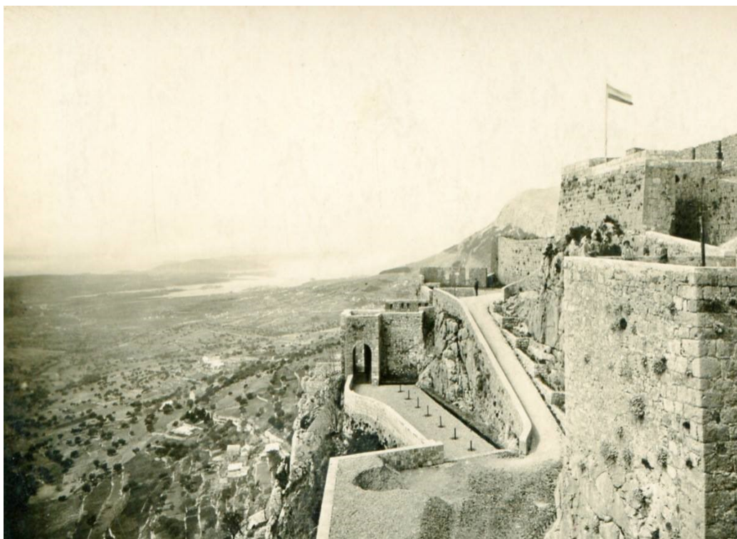
Slika 5. Tvrđava Klis- povijest