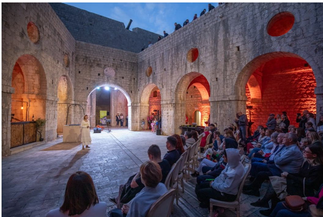
Slika 8. Predstava na tvrđavi Lovrijenac