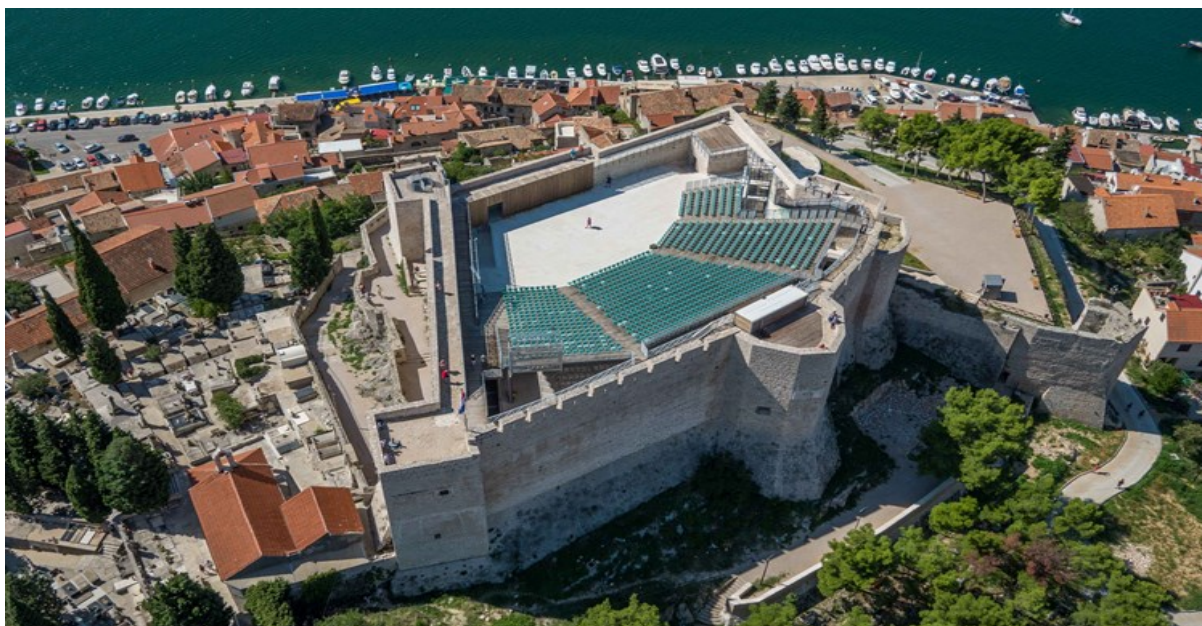
Slika 3. Tvrđava sv. Mihovila nakon revitalizacije