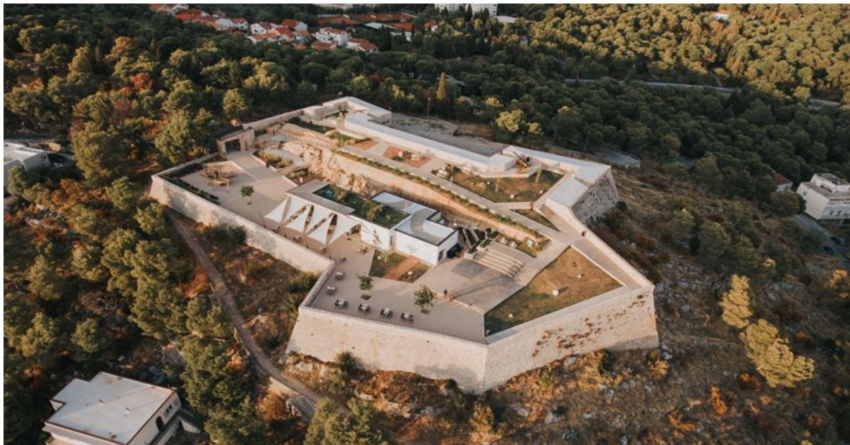
Slika 4. Tvrđava Barone nakon revitalizacije

promocije, radionice za djecu i mnoga druga događanja koje poboljšavaju kulturni život građana i život građana Šibenika općenito te pomažu u povezivanju lokalnog stanovništva. Tvrđava Barone zamišljena je kao pozornica na otvorenom za razne događaje. „Ljeti Barone postaje jazz pozornica i kino na otvorenom. Sjajne jazz koncerte donosi Barone Jazz Festival, a Ljetno kino Barone probrane filmske naslove koji već godinama na tvrđavu privlače publiku željne kvalitetnog programa,, (Tvrđava kulture Šibenik, 2024). Upravo veća okrenutost prema lokalnom stanovništvu je ono što razlikuje Tvrđavu Barone od Tvrđave sv. Mihovila. Na tvrđavi se također nalazi i ugostiteljski objekt u kojem mnogobrojni turisti, tijekom sezone, ali i mnoštvo lokalnog stanovništva uživa cijele godine. Iz navedenog bitno je zaključiti da je Tvrđava Barone postala prostor u kojem se organiziraju kulturna događanja kojih je prijašnjih godina manjkalo.