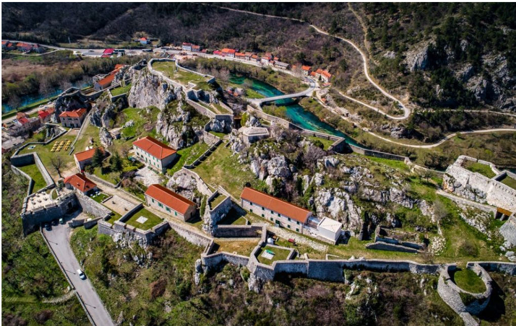
Slika 9. Kninska tvrđava iz zraka

koja je bila odlučujuća za oslobođenje Knina i šireg područja. Knin, kao strateški važan grad i začetak srpske pobune u Hrvatskoj, bio je glavno uporište samoproglašene i samoprozvane "Republike Srpske Krajine" i jedno od najutvrđenijih mjesta pod srpskom kontrolom. Kninska tvrđava služila je kao vojna baza i kontrolna točka srpskih snaga, zbog svoje dominantne pozicije nad gradom i okolnim područjem. Srpska vojska koristila je tvrđavu za smještaj vojnika, kao komunikacijski centar i za nadzor nad ključnim prometnim pravcima. Zbog svoje strateške važnosti, tvrđava je bila meta hrvatskih snaga tijekom operacije Oluja, koja je počela 4. kolovoza 1995. godine. Nakon brzog i uspješnog napredovanja Hrvatske vojske, Knin je oslobođen 5. kolovoza 1995., čime je završila četverogodišnja srpska kontrola, odnosno agresija, nad gradom. Osvajanjem Kninske tvrđave simbolički je završena vojna operacija Oluja, a t danas se taj dan obilježava kao Dan pobjede i domovinske zahvalnosti te Dan hrvatskih branitelja. Kninska tvrđava, zbog svoje povijesne i strateške važnosti tijekom rata, postala je i jest simbol hrvatske pobjede i slobode, te se svake godine na njoj održava središnja proslava Dana pobjede. Na tvrđavi se tada podiže hrvatska zastava, kao podsjetnik na ključni trenutak oslobođenja Knina i Hrvatske.