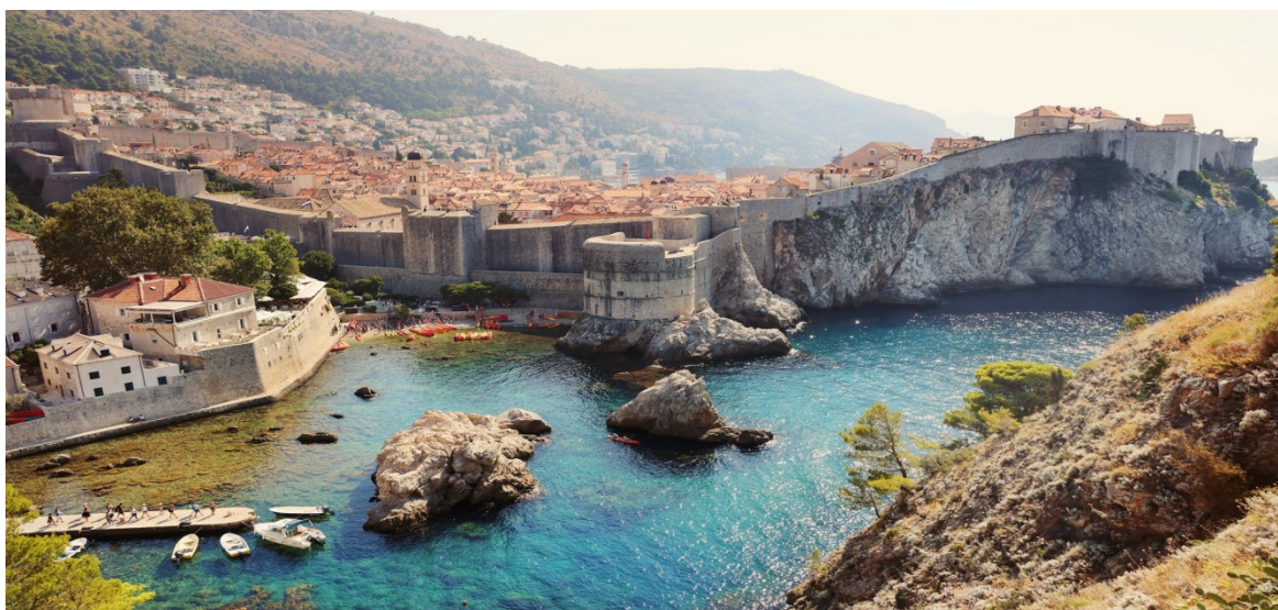
Slika 7. Dubrovnik danas