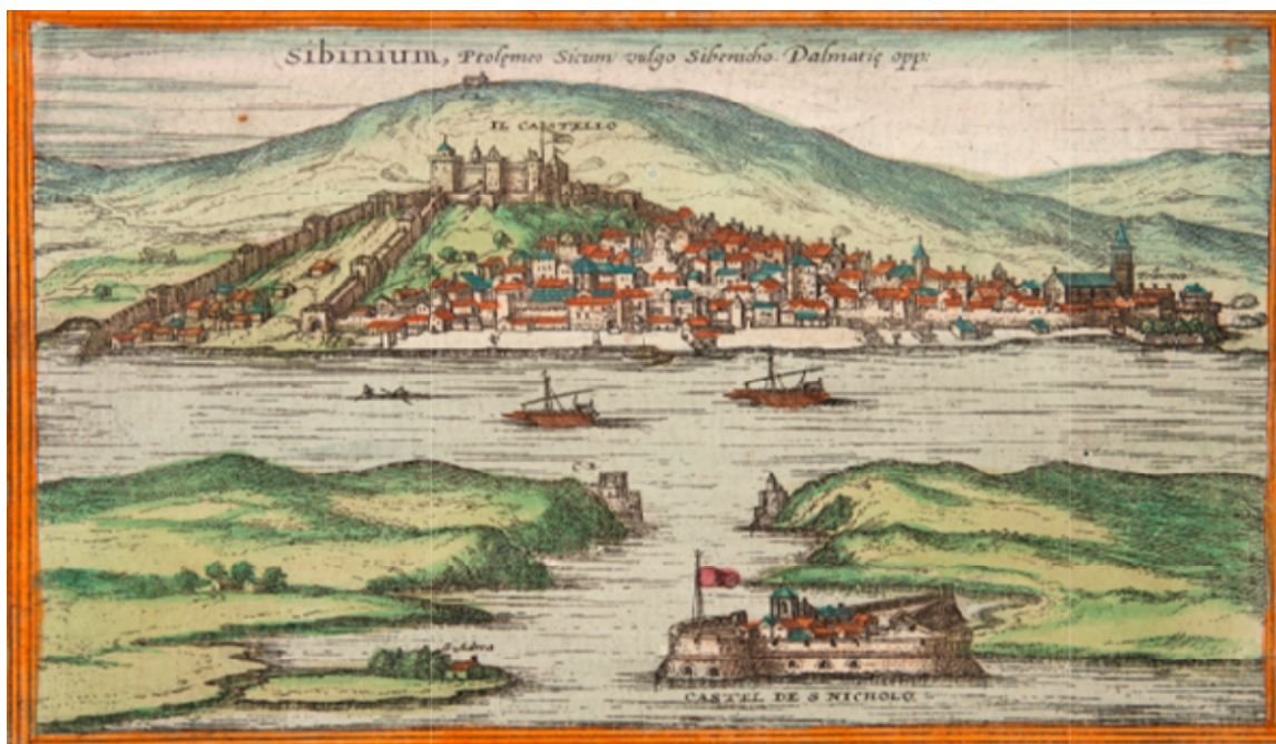
Slika 1. Veduta Šibenika iz 1575. s Tvrđavom sv. Mihovila nad gradom (F. Hogenberg i G. Braun – bakrorez)