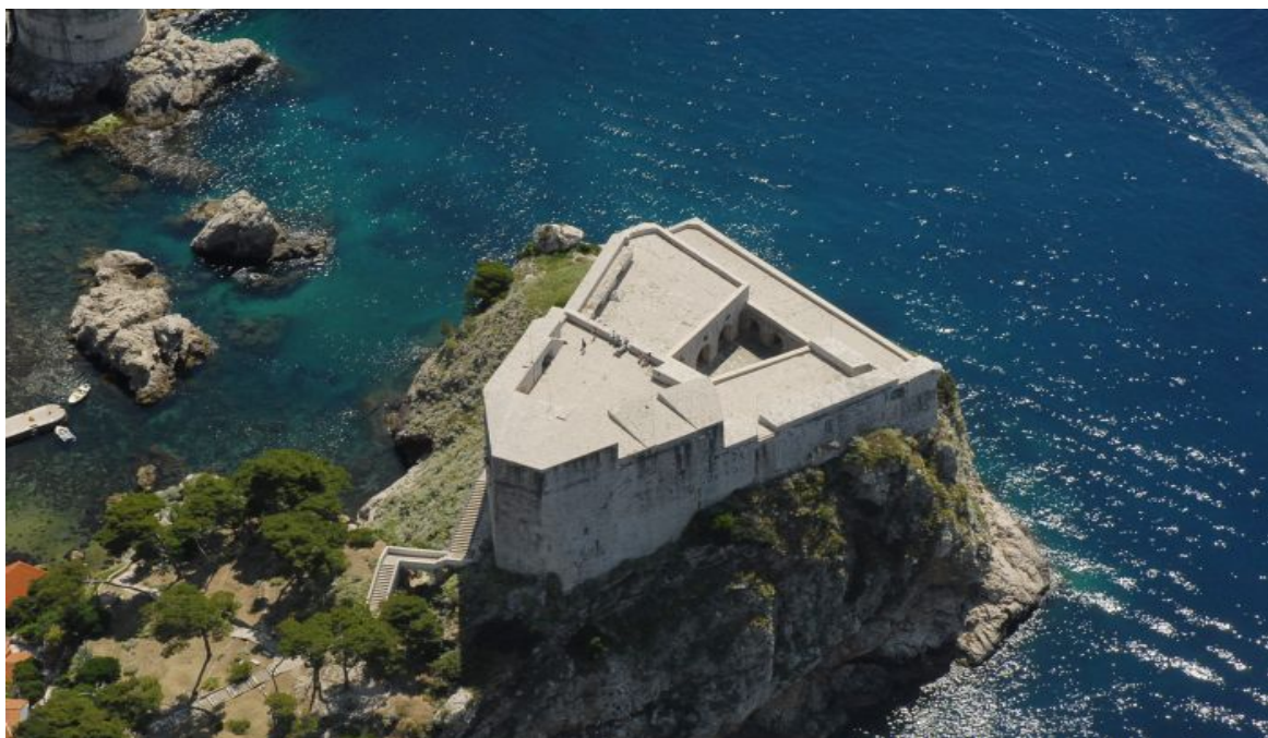
Slika 6. Tvrđava Lovrijenac