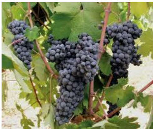
Slika 5: Crljenak kaštelanski – hrvatska autohtona crna vinska sorta