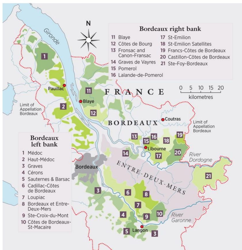
Slika 1. Bordeaux vinska regija