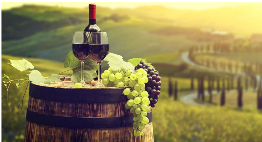
Slika 2. Vinska regija Toskane