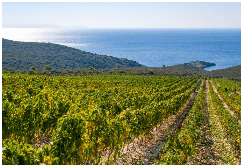
Slika 4: Vinogradi Lumbarde

ime koje znači "Grk" na hrvatskom. Ipak, unatoč njegovim možebitnim korijenima, Grk je nesumnjivo postao potpuno dalmatinski, s jedinstvenim karakteristikama koje su se razvile tijekom generacija adaptacije na lokalne uvjete. Grk je poznat po svojim malim, gustim grozdovima s debelim kožicama koje su iznimno otporne na vruće i suhe uvjete koji vladaju na otoku Korčuli. Ove karakteristike čine Grk idealnom sortom za uzgoj u mediteranskom klimatskom kontekstu, gdje vruća ljeta i kameno tlo postavljaju specifične izazove. Zanimljivo je da Grk cvjeta i razvija plodove samo na jednoj strani grozda, što je neuobičajeno i dodaje dodatni sloj zanimljivosti kod kultivacije ove sorte (Hrvatska turistička zajednica, 2024).