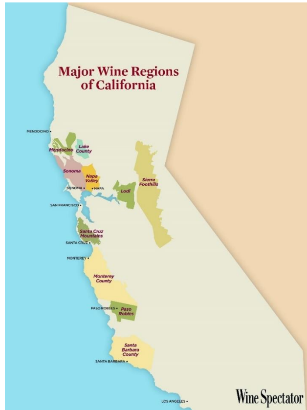
Slika 3. Glavne vinske regije Kalifornije