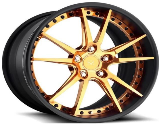
Slika 2. Aluminijski kotač, izvor: https://hr.sushaforgedwheel.com/forged-wheels/2-piece-forged-wheels/for-rs4-rims-18-19-20-21-22-inch-2-pc-forged.html

Unatoč raznim prednostima, aluminijski kotači ipak imaju i nekoliko nedostataka. Jedan od njih je viša cijena u usporedbi s čeličnim kotačima. Zbog kompleksnijeg proizvodnog procesa i skupljih materijala, za aluminijske kotače uglavnom je potrebno izdvojiti više novca, što može predstavljati značajan trošak prilikom kupovine novih kotača ili zamjene postojećih.