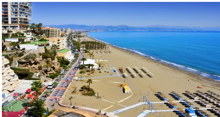
Slika 17. Plaža Terremolinos