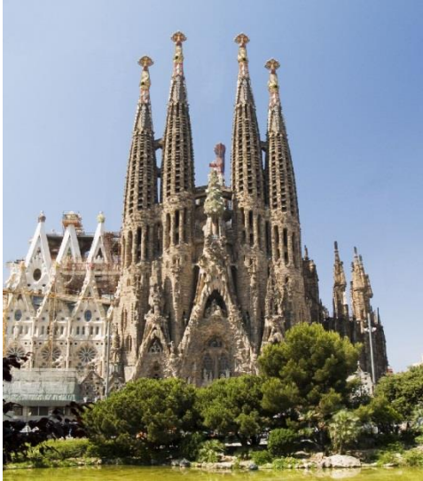
Slika 9. Katedrala u Barceloni (Sagrada Familia)