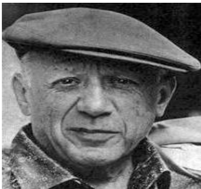
Slika 11. Pablo Picasso