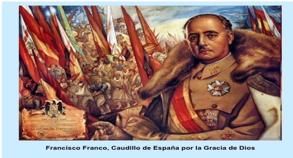
Slika 2. Caudillo Francisco Franco