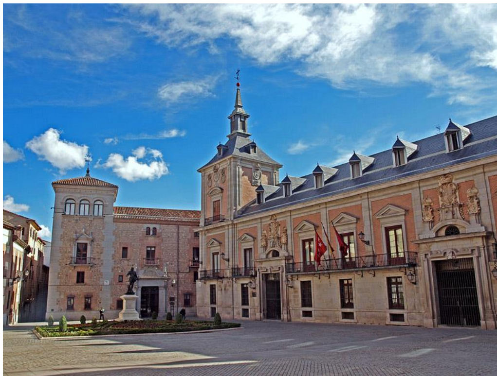
Slika 5. Plaza de la Villa