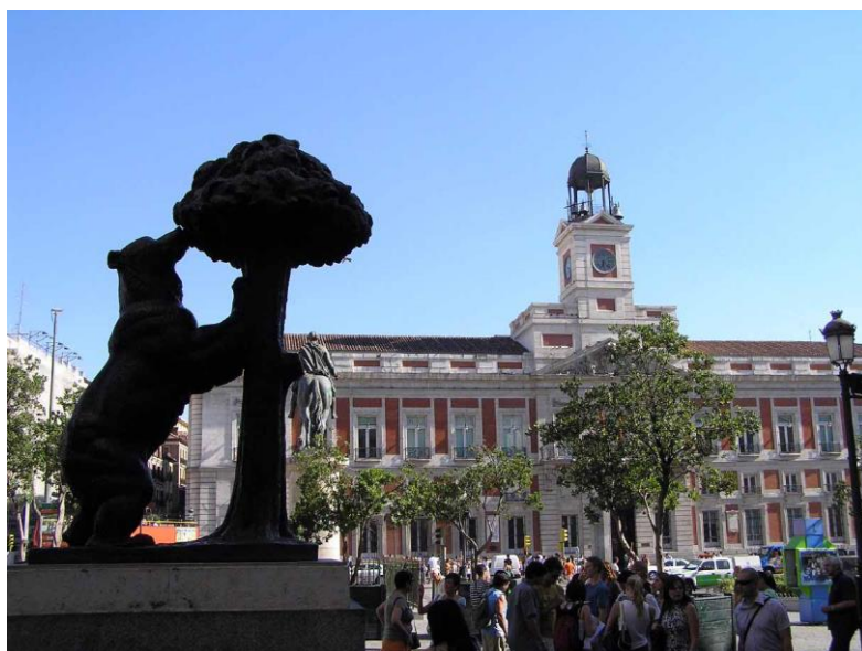
Slika 4. Puerta del Sol