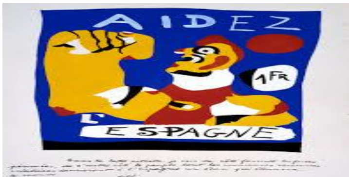
Slika 3. Juan Miro: plakat potpore Španjolskoj republici