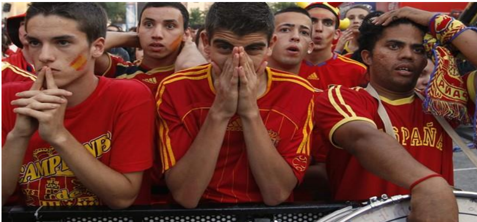
Slika 14. Španjolski navijači