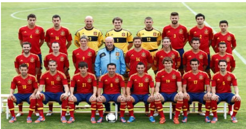
Slika 15. Nogometna reprezentacija Španjolska