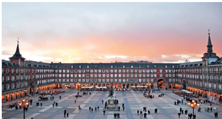
Slika 6. Plaza Mayor