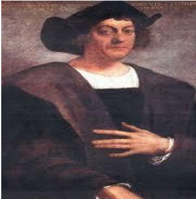
Slika 10. Cristoforo Colombo