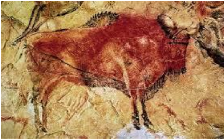
Slika 1. Pećinski crtež u Altamiri