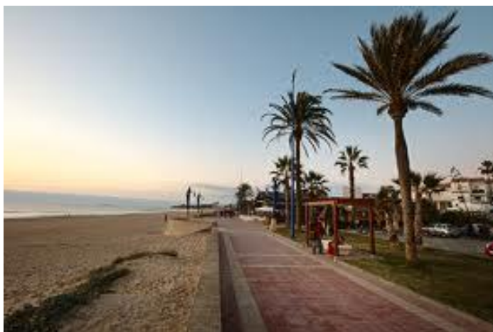
Slika 16. Pogled na La Barrosu