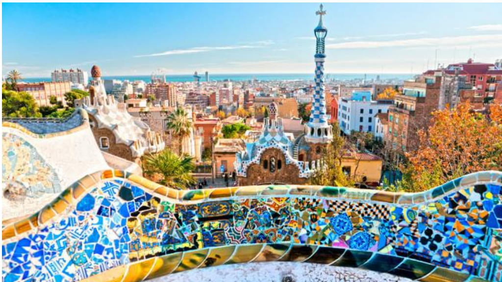
Slika 7. Barcelona

Izvor: https://www.google.hr/search?q=barcelona&biw (11.7.2015.)