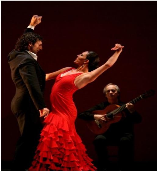
Slika 18. Flamenco