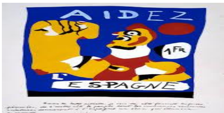
Slika 3. Juan Miro: plakat potpore Španjolskoj republici