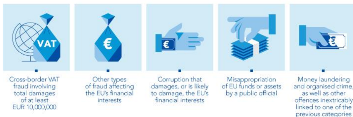
Slika 3. Kaznena djela pod ovlastima EPPO-a