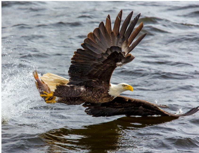
Slika 1. Orao štekavac.

Kopački rit je park prirode koji se nalazi u samom kutu što ga čine rijeka Dunav zajedno sa pritokom Dravom. Izgled Kopačkog rita je ovisan o vodostaju dviju rijeka koje ga neprestano oblikuju na različite načine. Upravo se tako dobiva zaista lijep mozaik jezera, kanala, poplavnih šuma, bara i greda, trsaka te vlažnih livada. Kopački se rit smatra jednim od najbolje očuvanih poplavnih područja u Europi, a specijalni zoološki rezervat je najvrjedniji dio parka. Područje Kopačkog rita karakteristično je po velikoj biološkoj raznolikosti i ljepotama krajobraza. Kompletan Kopački rit je poznato stanište za razne ptice močvarice te je poznat po populaciji običnog jelena, a izrazito orla štekavca koji je simbol ovog parka, a prikazan je na slici 1 (Kopački rit: O parku, n.d.).