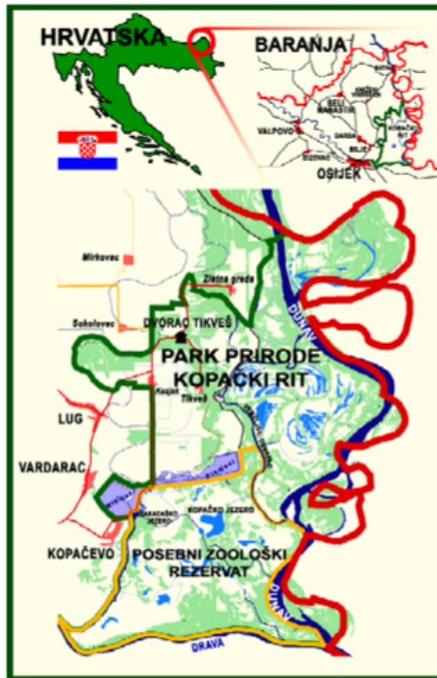
Slika 2. Geografski položaj parka prirode Kopački rit.