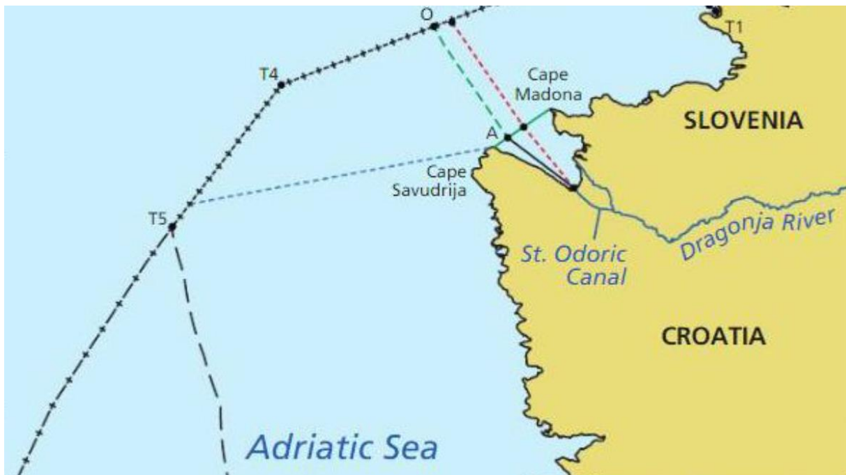
Slika 2. Podjela granica mora između Hrvatske i Slovenije odlukom Arbitražnog suda