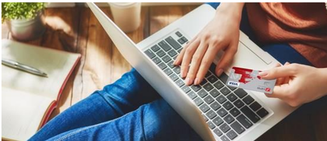
Slika 3. Sigurnije i brže plaćanje karticama HPB-a na internetu dostupno na http://skr.rs/zkOK

Kako bi svojim klijentima omogućila jednostavnije i sigurnije plaćanje karticama na internetu Hrvatska poštanska banka uvela je poboljšanu biometrijsku metodu autentifikacije plaćanja koja je ostvarena implementacijom naprednije verzije 3Dsecure standarda v.2 za provođenje online plaćanja uz višu razinu sigurnosti te dodatnu zaštitu od prevara korištenjem naprednijih načina provjere njihove autentičnosti prilikom online kupnje.