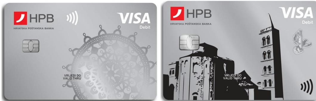
Slika 2. Visa debit kartica tekućeg i žiro računa

HPB u svojoj ponudi ima i CRO Visa karticu. To je debitna beskontaktna kartica vezana za transakcijski račun posebne namjene. Naime, svaki poslodavac u RH može isplatiti naknadu namjenjenu za odmor svojim djelatnicima preko CRO Visa kartice. Ova kartica služi isključivo za plaćanje na fizičkim prodajnim mjestima u Republici Hrvatskoj određenim Javnim pozivom Ministarstva turizma (hotelima, motelima, rezortima, kampovima, odmaralištima, sportskim i rekreacijskim kampovima, objektima seoskog turizma, restoranima, kafićima, za usluge putničkih agencija, usluge iznajmljivanja i davanja u leasing plovnih prijevoznih sredstava).