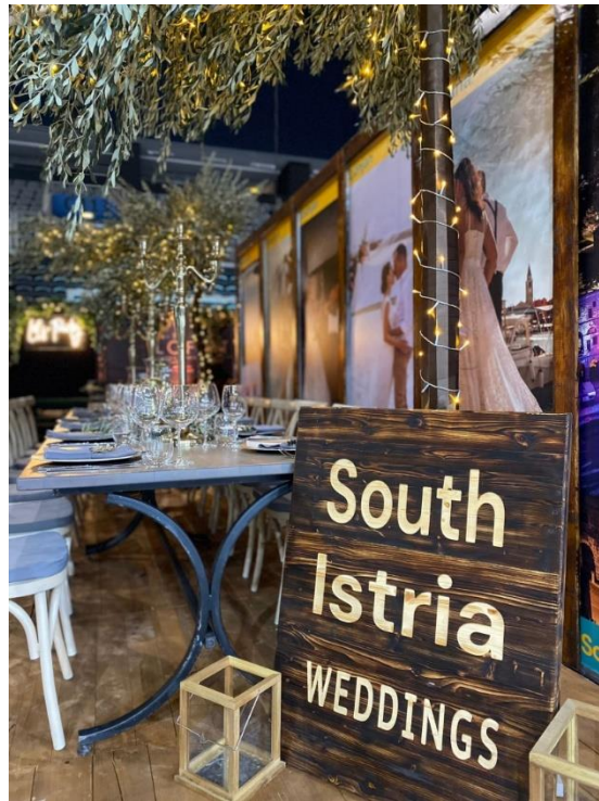
Slika 10. Klaster Južna Istra