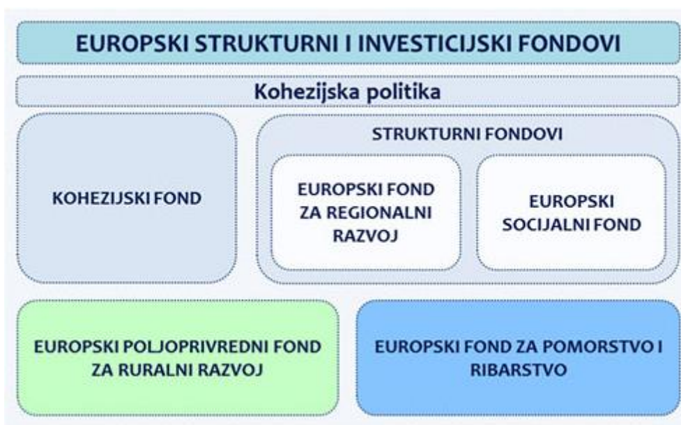
Slika 2: Shematski prikaz ESI fondova