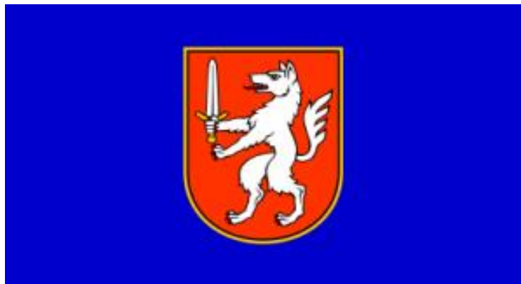
Slika. 3. Zastava grada Gospića