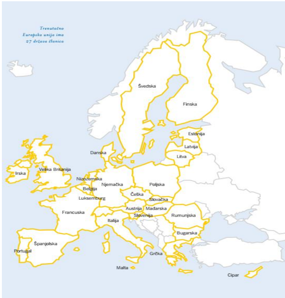
Slika. 2. Europska unija nakon šest krugova proširenja (27 država članica)