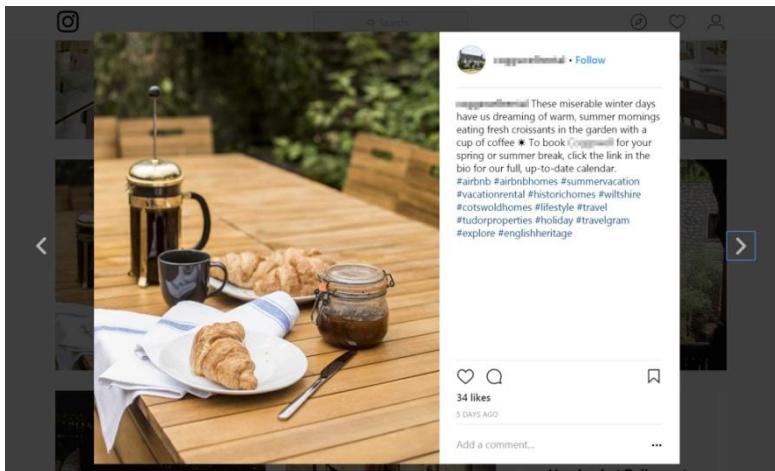
Slika 7. Promocija smještaja putem Instagrama

Instagram je ustvari dopunski kanal oglašavanja, ali osobniji i iskreniji - mjesto gdje se gostu otkrivaju detalji o apartmanu i destinaciji koju će posjetiti. Usto i potpuno besplatan. 25