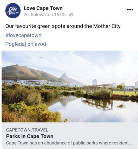
Slika 3. Promocija parkova Cape Town-a na Facebook profilu