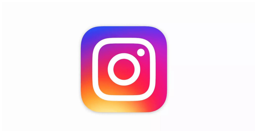
Slika 6. Službeni logo Instagrama

Može se reći kako je Instagram kombinacija društvenog umrežavanja i fotografske usluge. Najpopularnija aplikacija za obradu i dijeljenje fotografija, kojom se trenutno koristi oko 15 milijuna korisnika. Svaku fotografiju koju je izradila vaša kamera telefona moguće je obraditi u jednom od Instagram filtera te je podijeliti s ostalim korisnicima Instagrama. 23 Ova društvena mreža je kreativna i prije svega besplatna aplikacija pomoću koje fotografije i videozapisi u kratkom vremenu postaju viralni i šire se zajednicom istoimenog naziva. Ova inovativna aplikacija omogućava korisnicima širom svijeta da snime, obrade i podijele svoje doživljaje s prijateljima, poznanicima i pratiteljima. Na Instagramu možete pratiti koga god želite ako mu je pri tome profil javan. Ukoliko se netko odluči za privatni profil, da biste ga zapratili morat ćete ipak zatražiti dozvolu vlasnika profila. 24