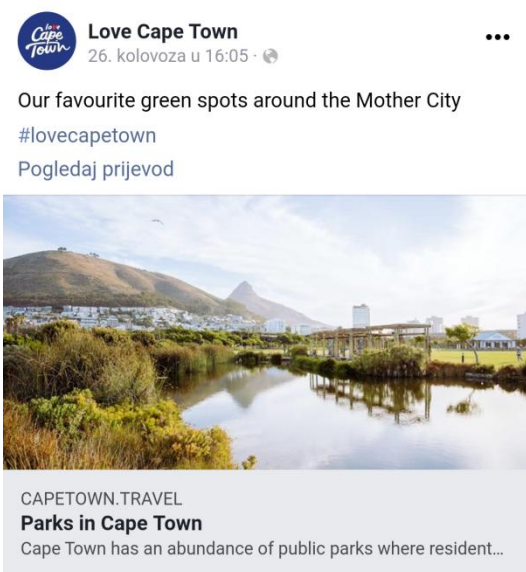
Slika 3. Promocija parkova Cape Town-a na Facebook profilu