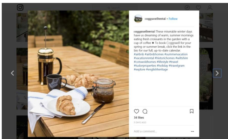
Slika 7. Promocija smještaja putem Instagrama

Instagram je ustvari dopunski kanal oglašavanja, ali osobniji i iskreniji - mjesto gdje se gostu otkrivaju detalji o apartmanu i destinaciji koju će posjetiti. Usto i potpuno besplatan. 25