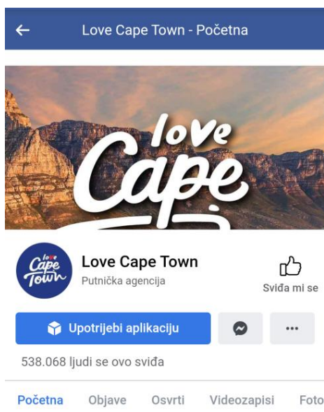
Slika 2. Facebook profil „Love Cape Town“

Jedan od primjera promocije turizma preko Facebooka je "Cape Town Turism". A ideja je bila otkriti nepoznata mjesta Cape Towna novim potencijalnim turistima. Osmislili su jednostavni predložak na koji su korisnici stavljali vlastite fotografije što je u konačnici rezultiralo impresijom da su sami korisnici aplikacije posjetili Južnu Afriku. Sve što su dodatno trebali napraviti bilo je podijeliti tu fotografiju na vlastitom profilu. Fotografije su se munjevitom brzinom proširile društvenim mrežama i ova kampanja ostaje jedna od najuspješnijih Facebook kampanja u svijetu.