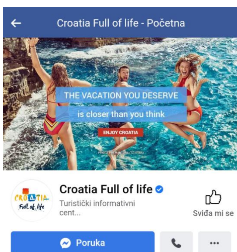
Slika 4. Službeni Facebook profil „Croatia full of life“

Nadalje, što se tiče promocije turizma i velike važnosti za turizam u Republici Hrvatskoj, veliku ulogu ima promocija Facebook stranice Hrvatske turističke zajednice pod nazivom Croatia full of life koja ima preko 1.7 milijuna pratitelja. Prosječna ocjena stranice kako su je ocjenili posjetitelji je 4.9 ,a svi posjetitelji Facebook stranice imaju mogućnost ostavljanja kratke recenzije i ocjenjivanja stranice s maksimalno pet zvjezdica. Facebook stranica Hrvatske turističke zajednice nosi oznaku verificirane Facebook stranice što znači da je riječ o originalnoj stranici.