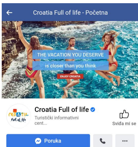
Slika 4. Službeni Facebook profil „Croatia full of life“

Nadalje, što se tiče promocije turizma i velike važnosti za turizam u Republici Hrvatskoj, veliku ulogu ima promocija Facebook stranice Hrvatske turističke zajednice pod nazivom Croatia full of life koja ima preko 1.7 milijuna pratitelja. Prosječna ocjena stranice kako su je ocjenili posjetitelji je 4.9 ,a svi posjetitelji Facebook stranice imaju mogućnost ostavljanja kratke recenzije i ocjenjivanja stranice s maksimalno pet zvjezdica. Facebook stranica Hrvatske turističke zajednice nosi oznaku verificirane Facebook stranice što znači da je riječ o originalnoj stranici.