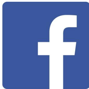
Slika 1. Službeni logo Facebooka

Ova web usluga je potpuno besplatna za sve korisnike, a prihode ostvaruje od sponzora i oglašavanja putem reklama koje se pojavljuju uz svaki profil. Profili s pravim imenom i prezimenom te autentične informacije o pojedinim korisnicima razlozi su planetarne popularnosti Facebooka. Danas ova web stranica ima više od 500 milijuna aktivnih korisnika. Facebook je ujedno najpopularnije mjesto za objavljivanja fotografija, s više od 14 milijuna novih dodanih fotografija dnevno. Facebook ima znatno veći broj od korisnika ostalih društvenih mreža. 21