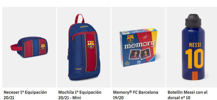
Slika 5. Ponuda suvenirnice stadiona Camp Noa iz Barcelone