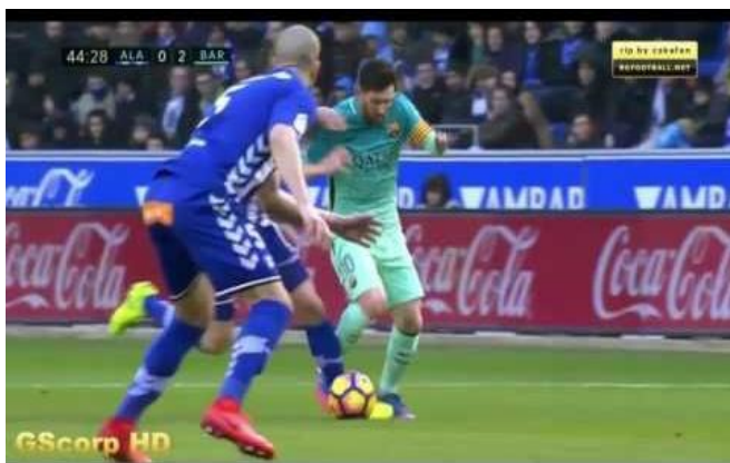
Slika 2. Reklame sponzora na terenu