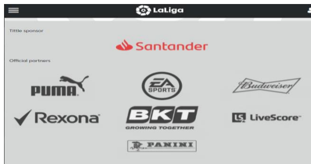
SLIKA 7. Sponzori La Lige

Madrida. Osim glavnog sponzora španjolsku ligu sponzoriraju Rexona, Puma, EA Sports, Budweiser, Live score, BKT- vodeći proizvođač guma, Panini, Microsoft 53