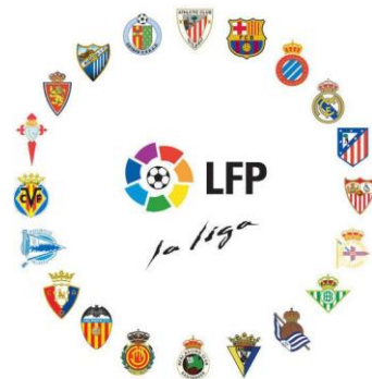
Slika 4. Klubovi Španjolske Lige 45