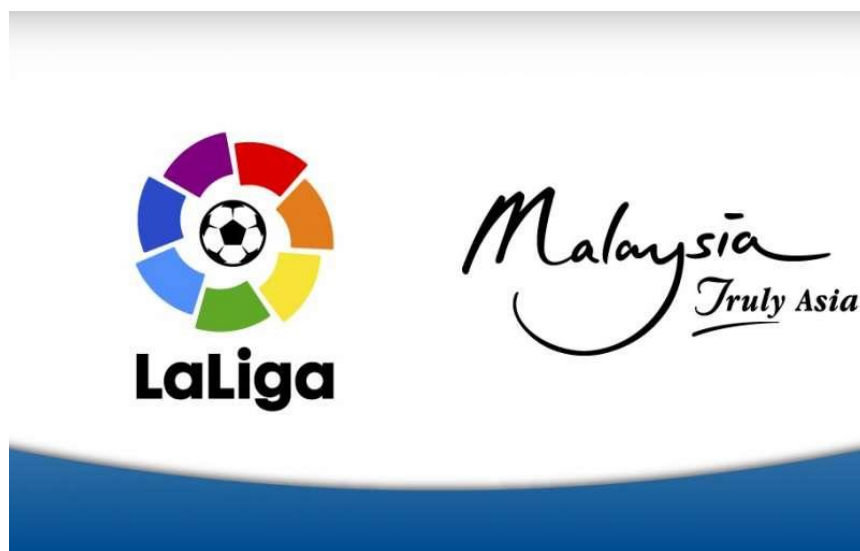
Slika 8. Objava u novim medijima o tek sklopljenom sponzorstu za Ligu

Svako novo sponzorstvo Liga redovito promovira (slika .) sa svojim navijačima i pratiteljima na svojim kanalima, nešto više o modernim tehnologijama i medijima koji predstavljaju budućnost reklamiranja i svih vrsta marketinga pa tako i sportskog upravo su novi mediji kao kanal komunikacije između klubova i njihovih pratitelja.