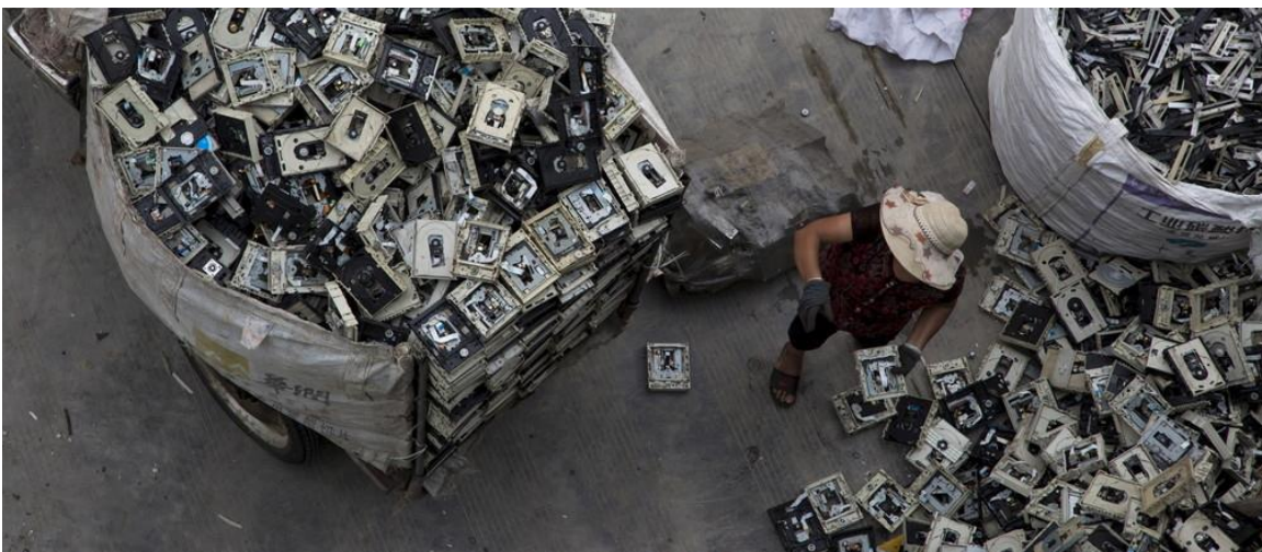
Slika 7. Problem EE otpada.