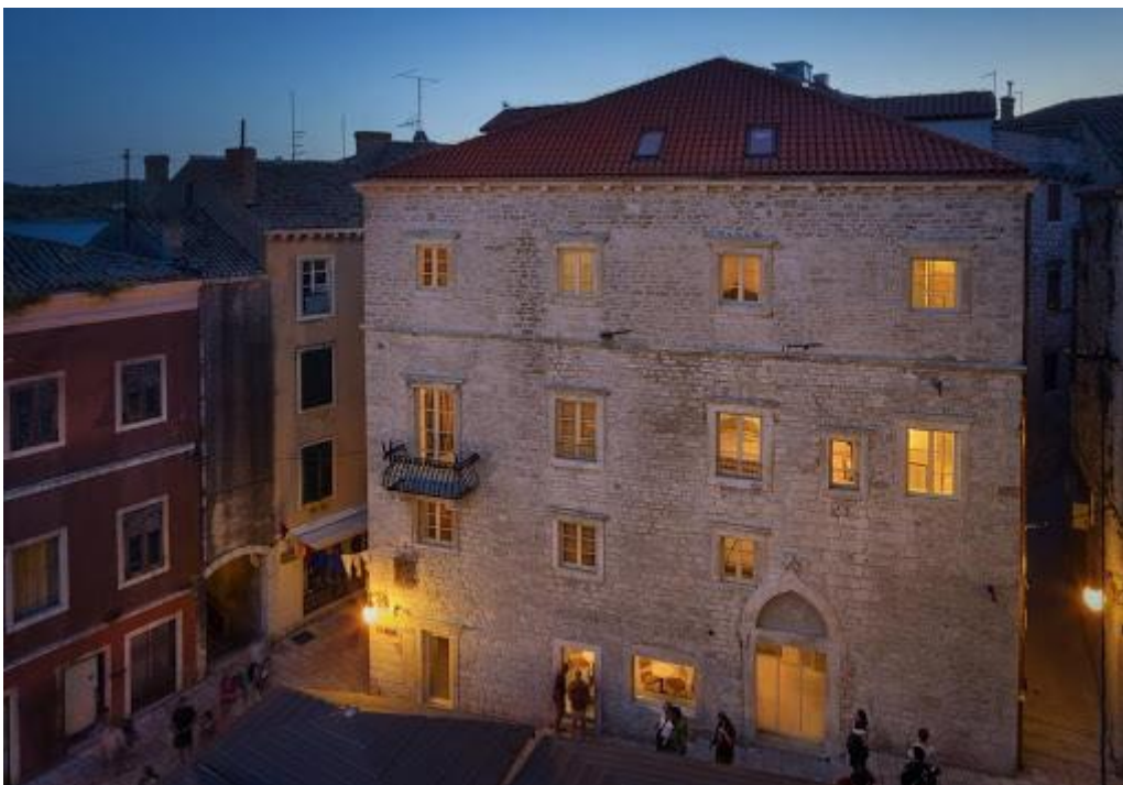
Slika 3. Hotel Life Palace Šibenik