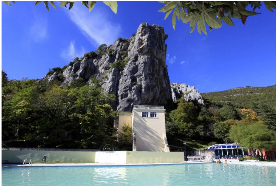
Slika 5. Istarske toplice