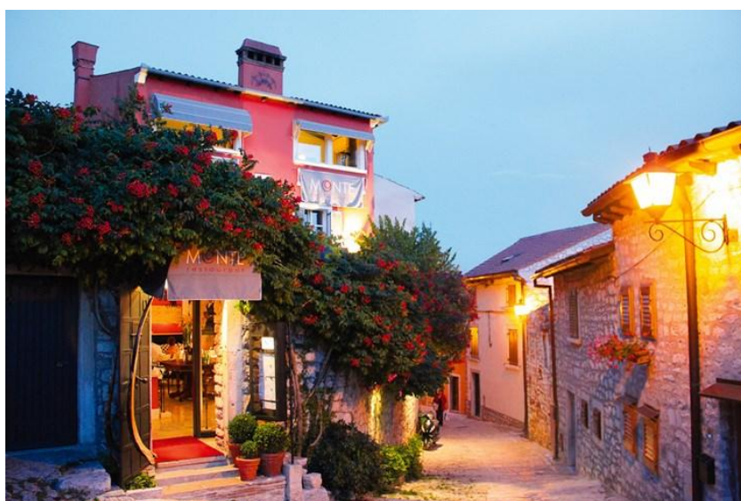
Slika 8. Restoran Monte, Rovinj

Restoran Monte u Rovinju ima dodjeljenu jednu Michelinovu zvijezdicu. Obiteljski restoran Monte bazira se na lokalnim namirnicama, na jadranskoj ribi i plodovima mora koji su pripremljeni modernim kuharskim tehnikama i vrhunski sljubljeni s povrćem i drugim domaćim sastojcima. Vodić Gourment Istra jedan je od najboljih promotivnih materijala eno - gastro događaja te općenito gastro turizma u Istri.