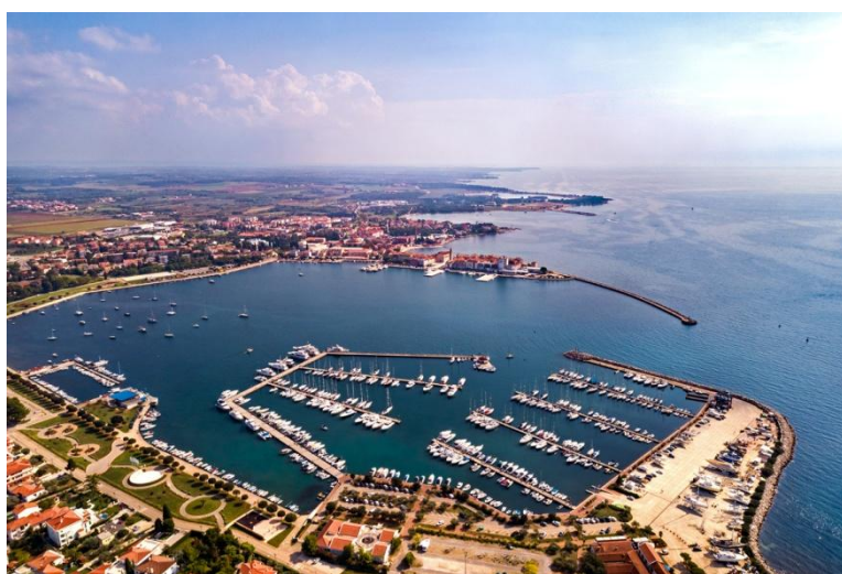
Slika 4. ACI marina Umag