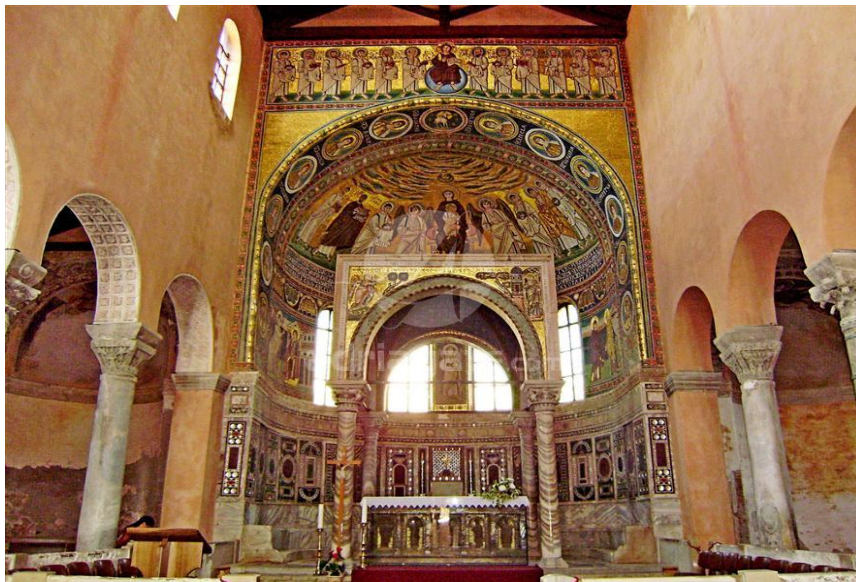
Slika 6. Eufrazijeva bazilika u Poreču