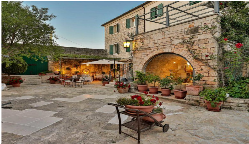
Slika 3. Bed&breakfast „La casa di Matiki“