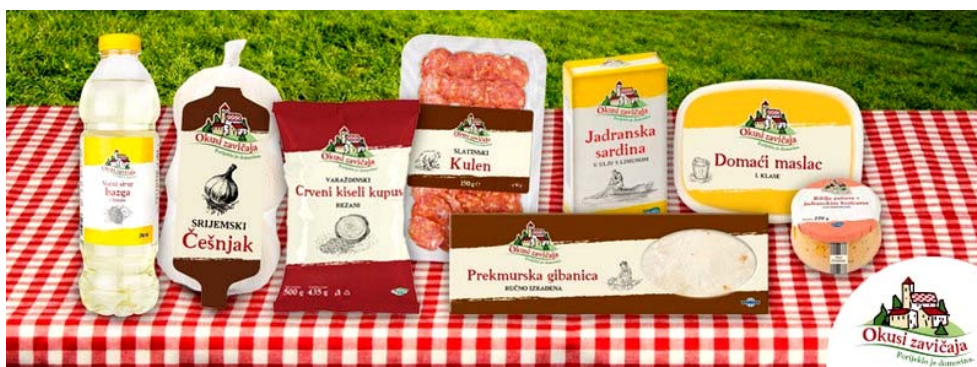
Slika 8. neki proizvodi u Lidlovoj trgovini iz asortimana Okusi zavičaja

Riječ je o marki koja je u lidlovom asortimanu od 2013. godine koja sadrži više od 70 proizvoda domaćih proizvođača. Linija Okusi zavičaja obuhvaća suhomesnate, riblje i mliječne proizvode, kruh i tjesteninu, voće i povrće, med i ulje prepoznatljive ambalaže i logotipa, koji simbolizira povezanost s