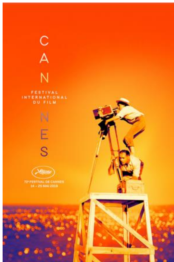
Slika 6: Cannes, Festival filma

U skupinu „off – location“ ubraja se široka paleta nešto drugačijih oblika provođenja filmskog turizma, a jedan od tih načina čine posjeti filmskim festivalima i manifestacijama. Jedan od najpoznatijih takvih festivala je filmski festival u Cannesu u Francuskoj, koji svake godine privuče više od trideset tisuća posjetitelja. To je najprestižniji europski i svjetski festival filma koji na jednom mjestu okuplja filmsku elitu iz čitavog svijeta te je zbog toga nedostupan široj javnosti. No vanfestivalski programi dostupni su za filmoljupce i posjetitelje koji imaju mogućnost gledanja filmova izvan službene selekcije, kao i najbolje filmove prijašnjih godina. Međunarodni filmski festival u Edinburghu 2010. godine primio je oko pedeset tisuća posjetitelja. U istu skupinu ubraja se i sudjelovanje na „red carpet“ svjetskim premijerama, pri čemu kvaliteta filma ne igra veliku ulogu.