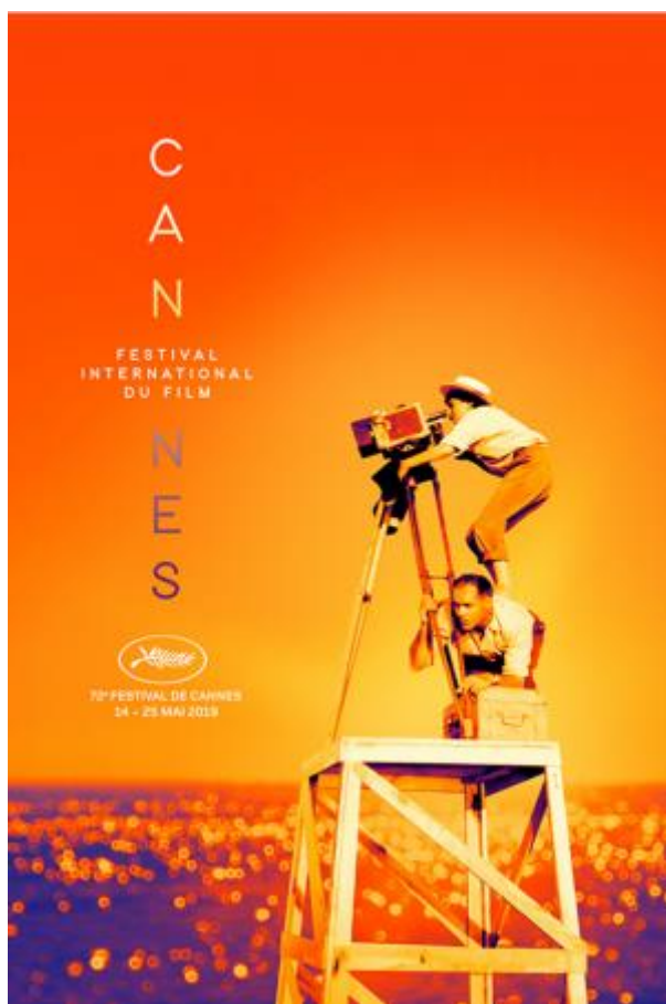
Slika 6: Cannes, Festival filma

U skupinu „off – location“ ubraja se široka paleta nešto drugačijih oblika provođenja filmskog turizma, a jedan od tih načina čine posjeti filmskim festivalima i manifestacijama. Jedan od najpoznatijih takvih festivala je filmski festival u Cannesu u Francuskoj, koji svake godine privuče više od trideset tisuća posjetitelja. To je najprestižniji europski i svjetski festival filma koji na jednom mjestu okuplja filmsku elitu iz čitavog svijeta te je zbog toga nedostupan široj javnosti. No vanfestivalski programi dostupni su za filmoljupce i posjetitelje koji imaju mogućnost gledanja filmova izvan službene selekcije, kao i najbolje filmove prijašnjih godina. Međunarodni filmski festival u Edinburghu 2010. godine primio je oko pedeset tisuća posjetitelja. U istu skupinu ubraja se i sudjelovanje na „red carpet“ svjetskim premijerama, pri čemu kvaliteta filma ne igra veliku ulogu.