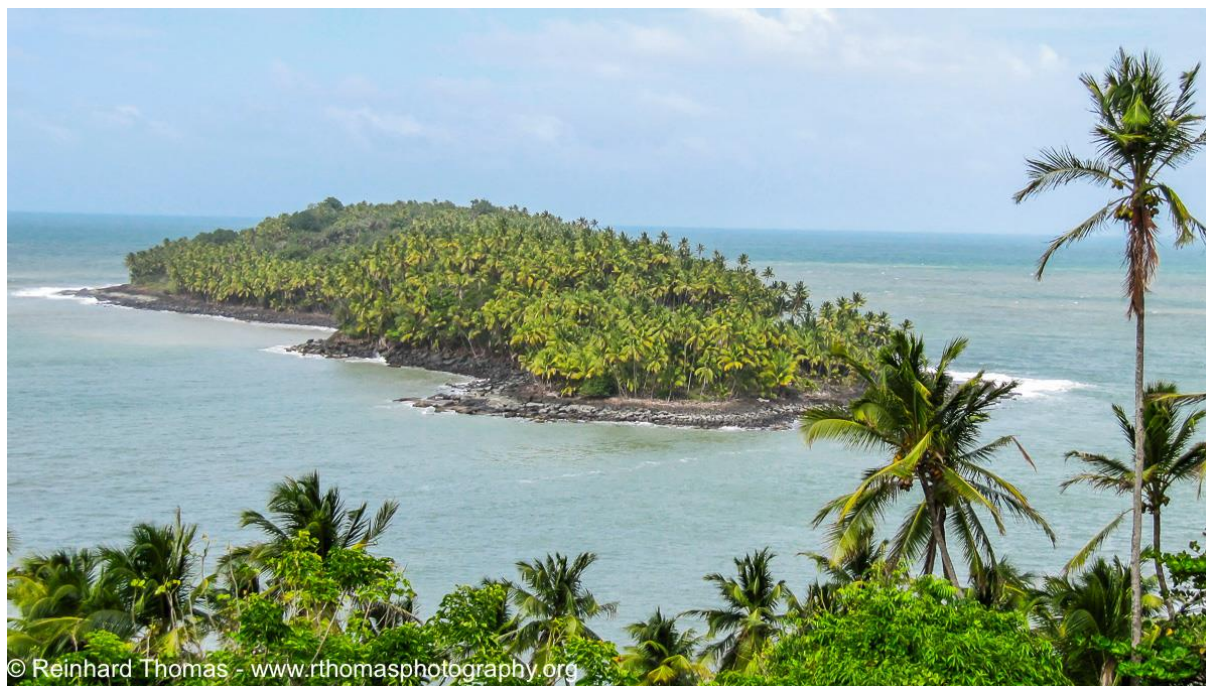
Slika 3: „Đavolji otok“

vlada ustanovila zatvoreničke institucije, te deportirala najgore kriminalce i političke neistomišljenike. Plan otočja isprva nije bio onakav kakvog se danas pamti. Prvotni plan bio je da otočje postane francuska kolonija, te je na otoke poslano oko dvanaest tisuća ljudi, no nedugo nakon dolaska, više od sedamdeset posto ljudi umrlo je na otočju iz raznih razloga.