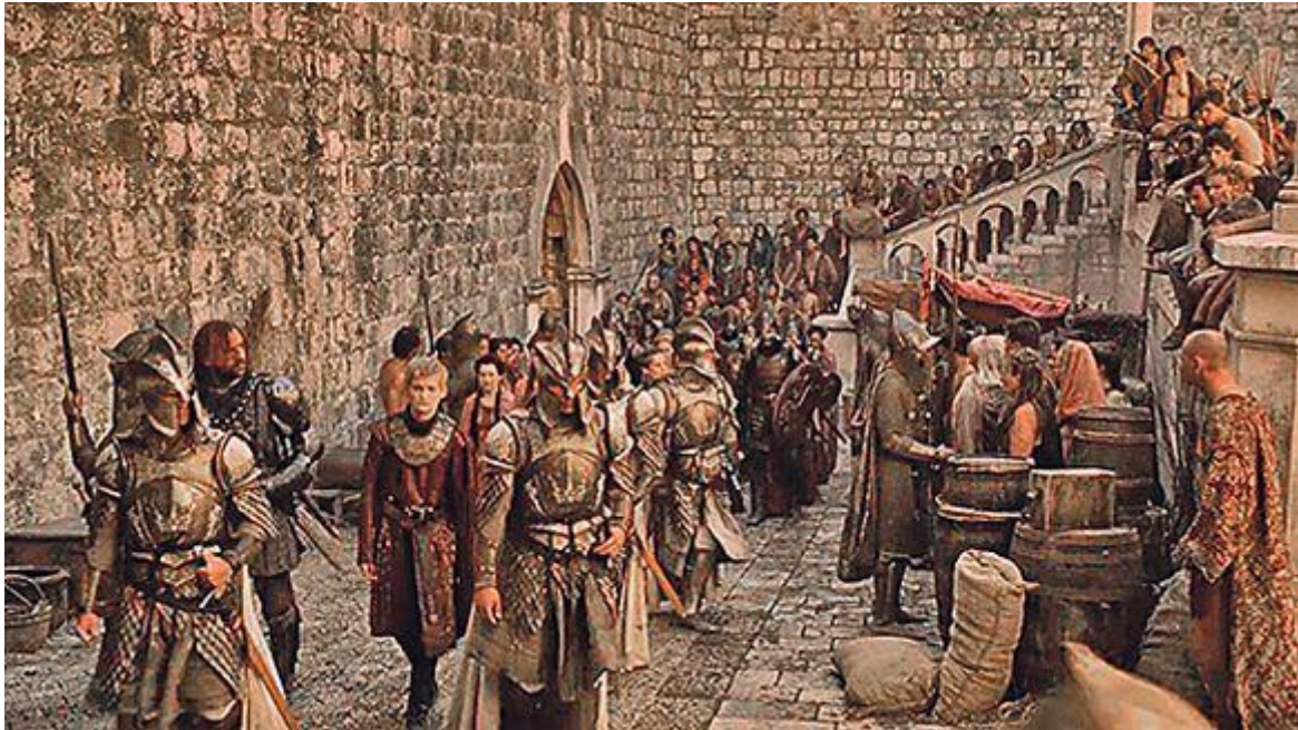
Slika 7: „Igra prijestolja“ ,Dubrovnik, Hrvatska