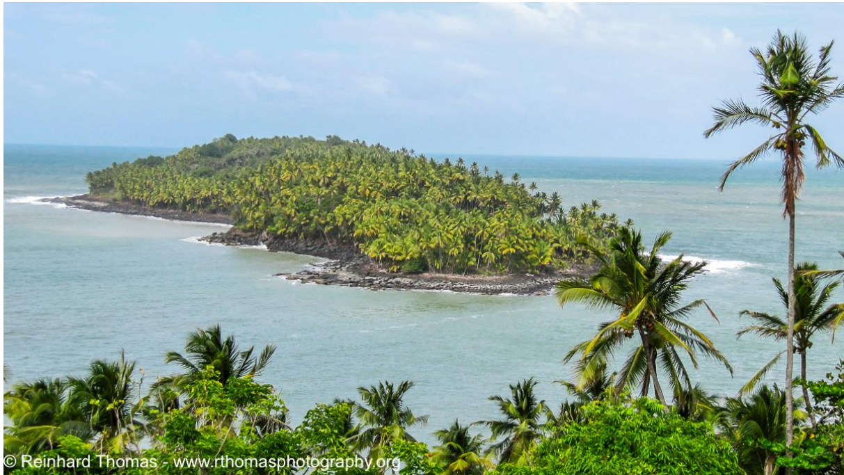
Slika 3: „Đavolji otok“

vlada ustanovila zatvoreničke institucije, te deportirala najgore kriminalce i političke neistomišljenike. Plan otočja isprva nije bio onakav kakvog se danas pamti. Prvotni plan bio je da otočje postane francuska kolonija, te je na otoke poslano oko dvanaest tisuća ljudi, no nedugo nakon dolaska, više od sedamdeset posto ljudi umrlo je na otočju iz raznih razloga.