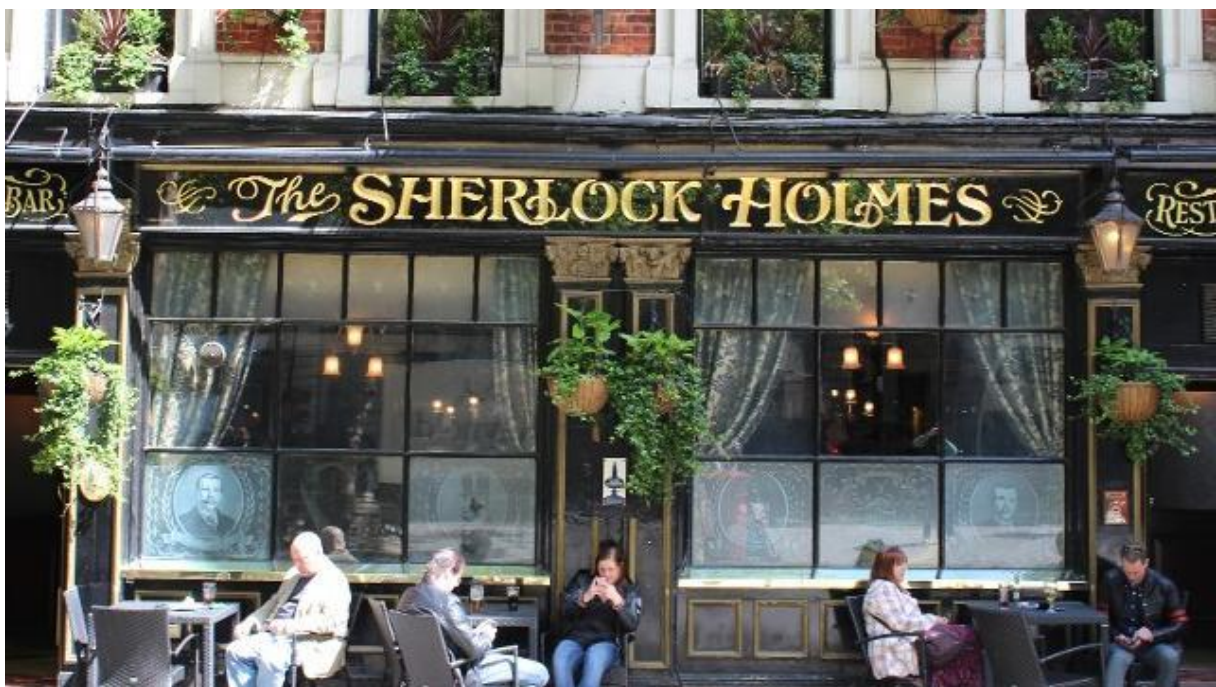
Slika 5: The Sherlock Holmes Pub London

Prijašnjim primjerima opisan je utjecaj filma i kinematografije u cjelosti, na određene lokacije i mjesta, no važno je znati da utjecaj filma može imati odražaja na čitavu državu, ponekad i kontinente. Velika Britanija postavlja se kao jedan od najsnažnijih konkurenata na tržištu filmskog turizma, ne samo zbog filmskog bogatstva i mnoštva lokacija snimanja, već i izvrsnom organizacijom ove grane turizma na multinacionalnoj razini. Filmski turizam je na prostorima Britanije već odavno prihvaćen, a aktivnosti su integrirane u gotovo svaki turistički proizvod kojeg nude. Iz tog razloga, i „slučajni“ turist imati će priliku upoznavanja lokacija snimanja i lokacija prikazanih u filmu ili seriji. Treba istaknuti da se filmske aktivnosti ne prodaju samo kao popratne, ili bonus aktivnosti. Dapače, postoji mnoštvo organiziranih izletničkih tura na kojima se može posjetiti i naučiti mnogo lokacija i zanimljivosti vezanih za određene filmove. U ponudi su ture bazirane na lokacijama iz „Harry Potter“ filmova, kao i „Game of Thrones“, „Doctor Who“, „James Bond“, „Sherlock Holmes“ itd.