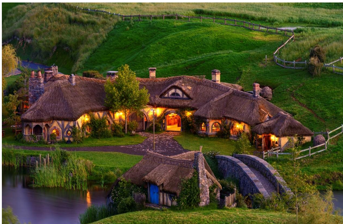
Slika 2: Hobbiton, movie set tours, Novi Zeland