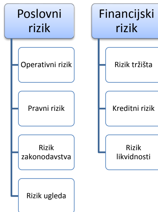
Slika 2. Osnovna podjela rizika