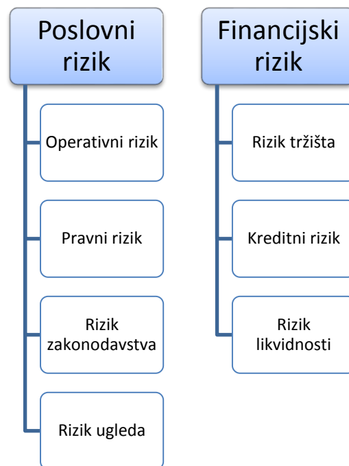
Slika 2. Osnovna podjela rizika