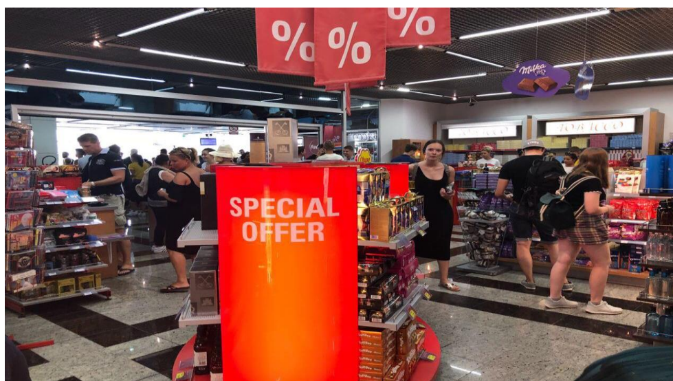
Slika 6. Duty free Shop