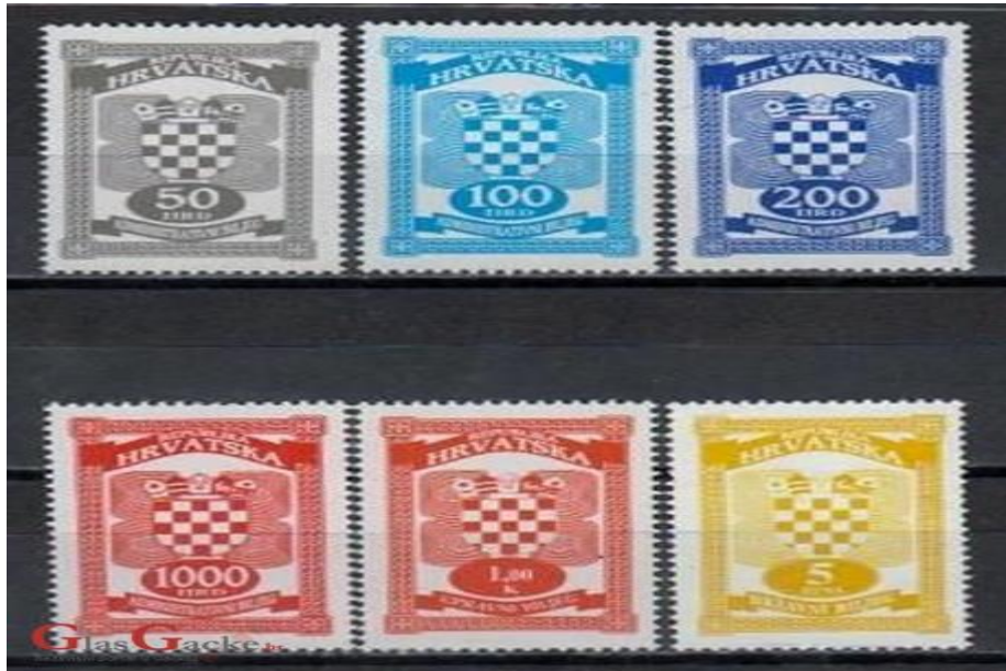
Slika 2. Takse